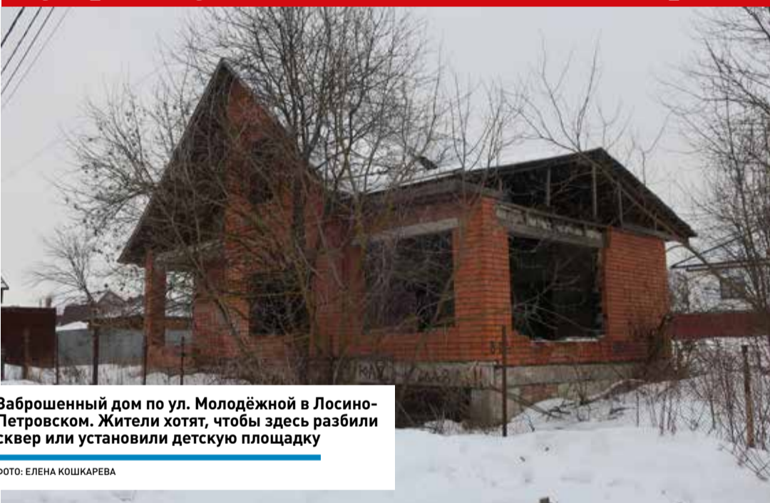
Заброшенный дом по ул. Молодёжной в Лосино-Петровском. Жители хотят, чтобы здесь разбили сквер или установили детскую площадку

Лосинопетровцы могут внести предложения по обустройству мест, освобождаемых от застройки