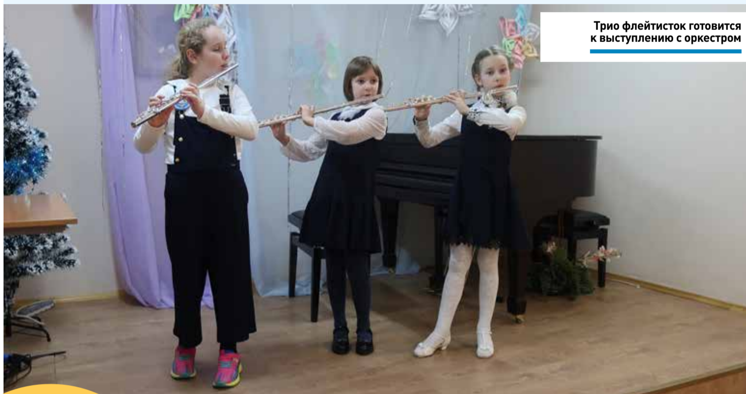
Три флейтисток готовится к выступлению с оркестром

Учащиеся Лосино-Петровской детской школы искусств выступят в сопровождении симфонического оркестра