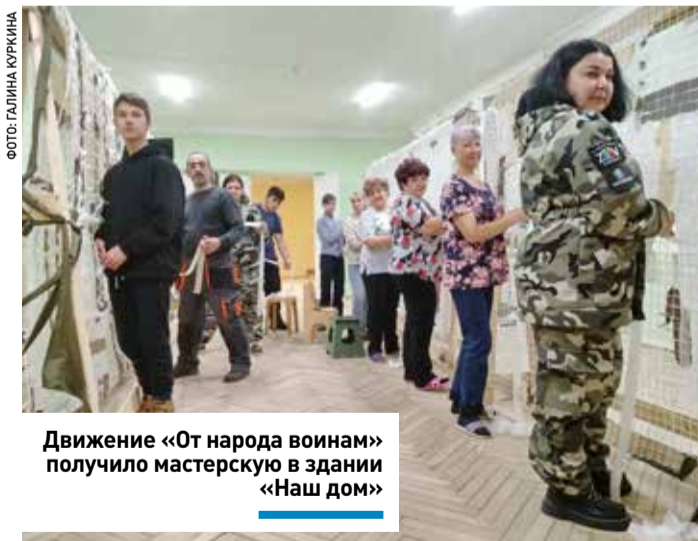
Движение «От народа воинам» получило мастерскую в здании «Наш дом»