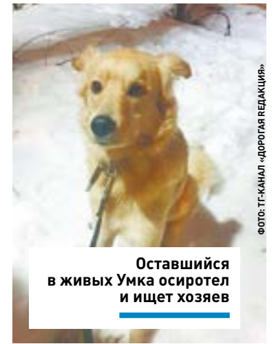
Оставшийся в живых Умка осиротел и ищет хозяев