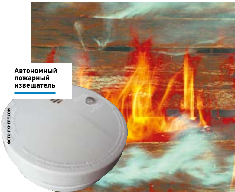
Автономный пожарный извещатель

По утверждению специалистов, для обнаружения пожара на ранней стадии очень эффективным устройством служит автономный пожарный извещатель, работающий на батарейках, который при малейшем задымлении издает громкий сигнал для оповещения людей