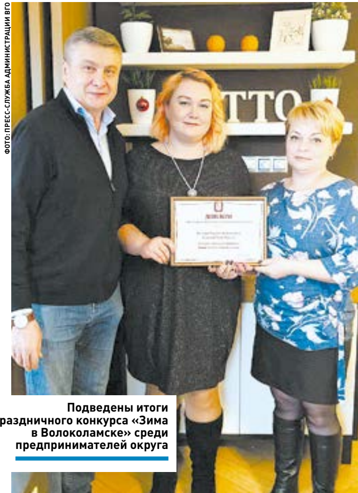
Подведены итоги праздничного конкурса «Зима в Волоколамске» среди предпринимателей округа

Мы вместе! В округе зарегистрировано более двух тысяч предпринимательских структур и уделяется большое внимание развитию малого и среднего бизнеса