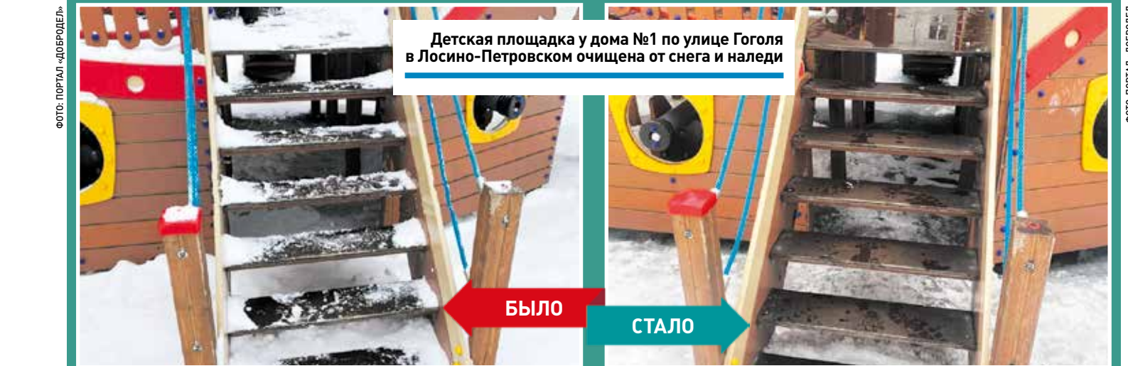
Детская площадка у дома №1 по улице Гоголя в Лосино-Петровском очищена от снега и наледи

– Требуется убрать остановку общественного транспорта, расположенную в Аничкове (Коз-