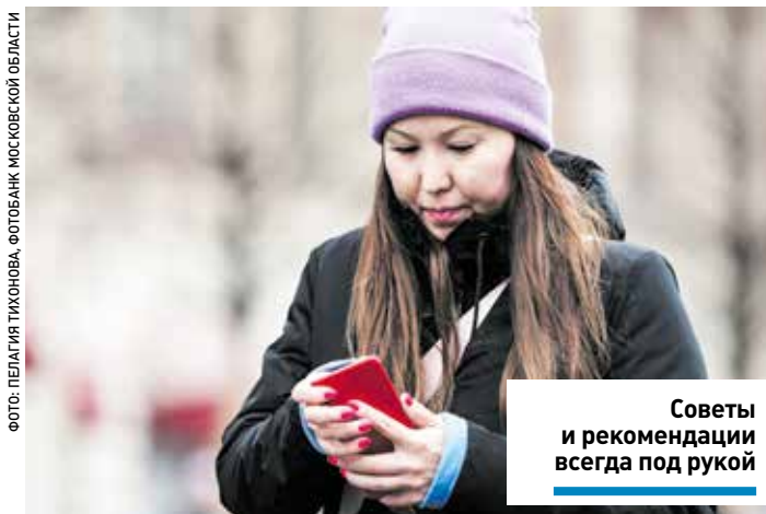
Советы и рекомендации всегда под рукой

В разделах «Родительский университет», «Справочник родителя» и «Мероприятия»