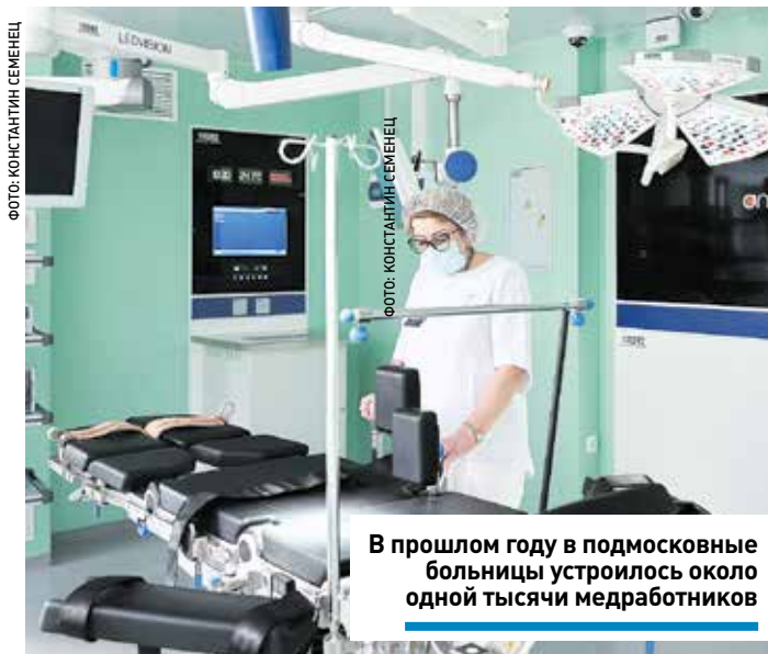
В прошлом году в подмосковные больницы устроилось около одной тысячи медработников

ВЕКТОР ] Губернатор Подмосковья поручил применять комплексный подход к подбору кадров и уделять внимание каждому приглашаемому специалисту