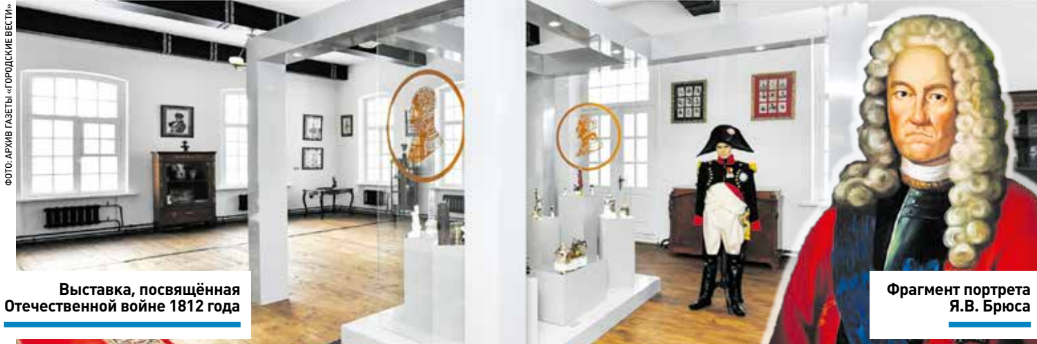
Выставка, посвящённая Отечественной войне 1812 года

Адрес: городской округ Лосино-Петровский, деревня Корпуса Сайт: usadba-brusa.ru Тел. +7 (916) 302-50-08