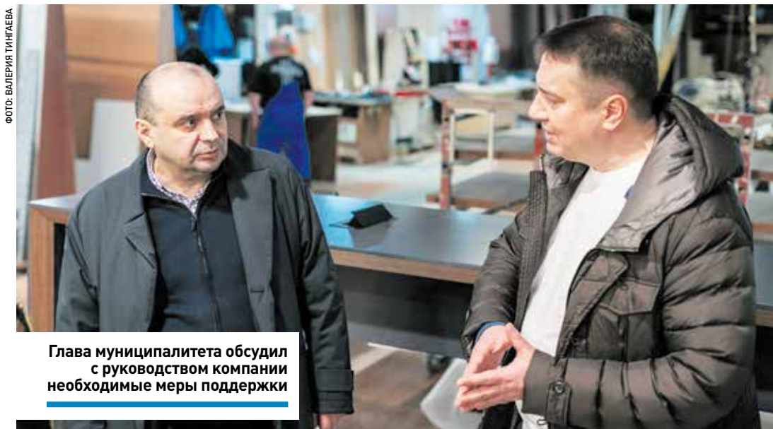
Глава муниципалитета обсудил с руководством компании необходимые меры поддержки

– Такие встречи преследуют главную цель – сказать и подтвердить своими действиями, что для нас и малое, и среднее, и крупное предпринимательство, промышленность, торговля, производство имеют принципиально важное значение. Хочу поблагодарить предпринимателей, которые в разные периоды – до ковида, в ковид, сейчас, в это непростое время – принимают решения по инвестициям, создают рабочие места. Развитие предпринимательства, экономики делает всех нас сильнее, создает другое каче-