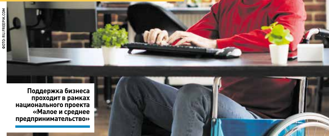
Поддержка бизнеса проходит в рамках национального проекта «Малое и среднее предпринимательство»

зала заместитель председателя правительства – министр инвестиций, промышленности и науки Московской области Екатерина Зиновьева.