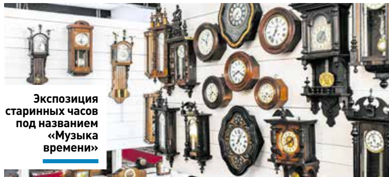
Экспозиция старинных часов под названием «Музыка времени»

Одна из знаменитых местных легенд гласит о наличии подземного хода из усадьбы Брюса в Берлюковский монастырь, протяженность его семь километров, и этот путь преодолели на карете, запряженной четверкой лошадей. В советское время поместье исследовали лозоходцы и пришли к выводу, что под землей до сих пор существуют обширные пустоты. Брюс не только сохранил древние подземные галереи, имеющие выходы за несколько ки-