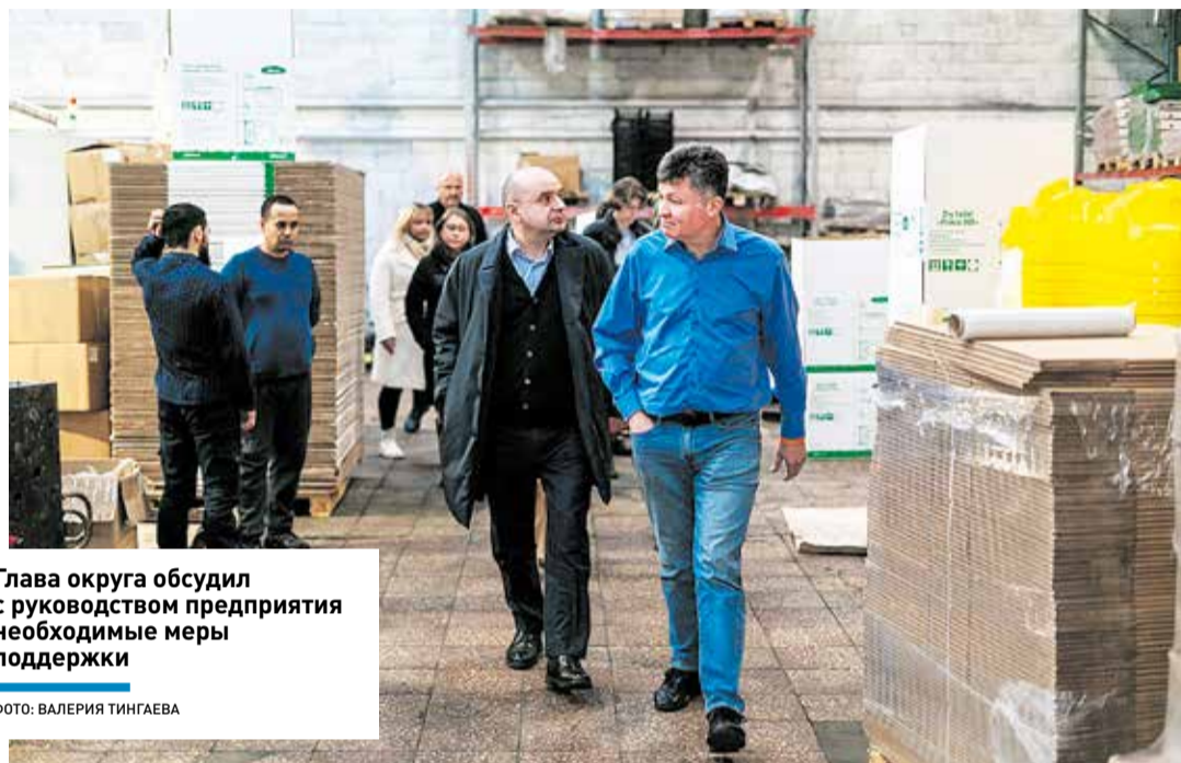
Глава округа обсудил с руководством предприятия необходимые меры поддержки

СВОЁ ДЕЛО ] Местная организация, производящая широкую линейку изделий из пластика – от детских товаров до деталей для машин – ищет новые площади и клиентов