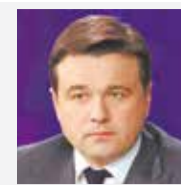
Андрей ВОРОБЬЁВ, губернатор Московской области: