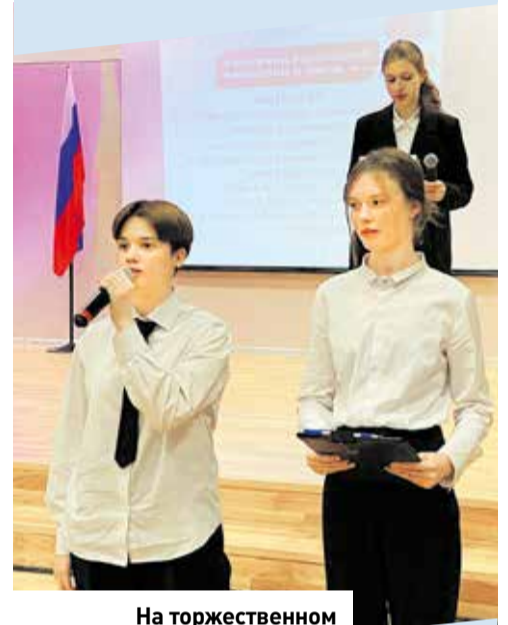
На торжественном мероприятии вступающие в ряды движения принесли клятву верности Родине

В Российское движение детей и молодёжи вступили учащиеся 4–11 классов школы №2 им. Владимира Дагаева. Перед лицом своих товарищей, а также в присутствии почётных гостей они дали торжественное обещание быть честными и справедливыми, любить свою Родину и укреплять её величие трудом, добром и верностью.