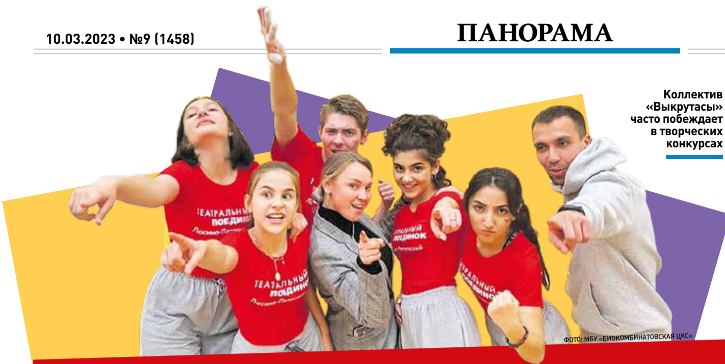
Коллектив «Выкрутасы» часто побеждает в творческих конкурсах