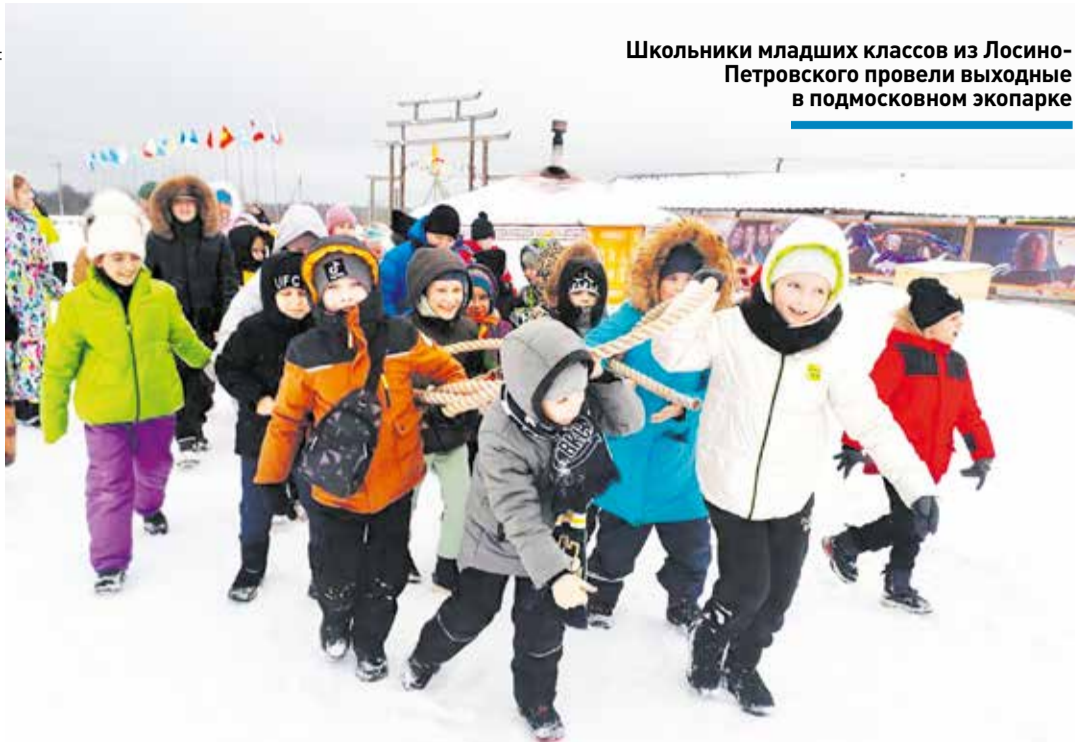
Школьники младших классов из Лосино-Петровского провели выходные в подмосковном экопарке