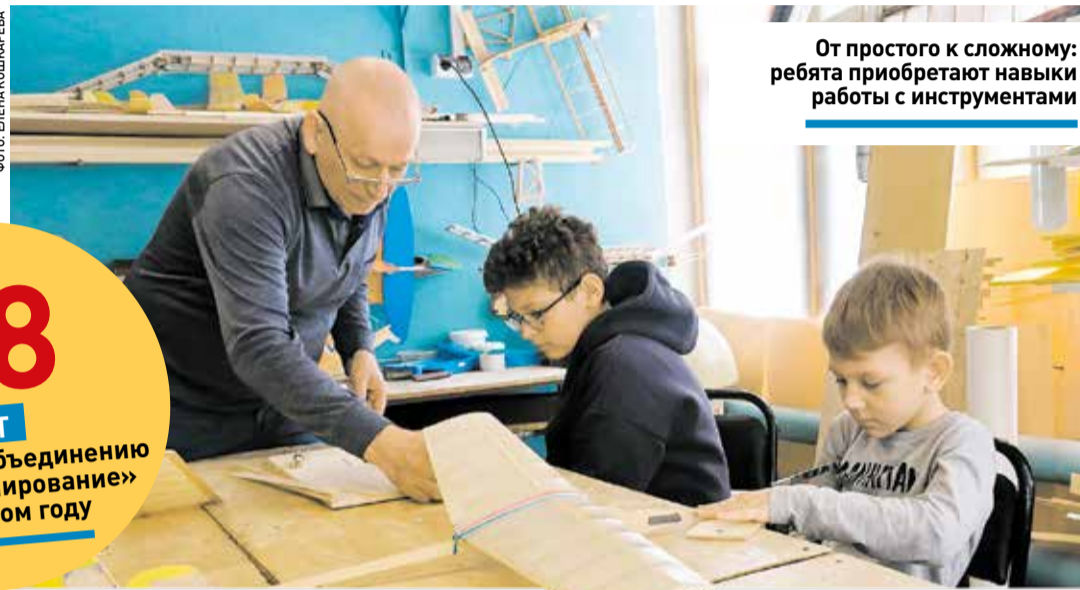
От простого к сложному: ребята приобретают навыки работы с инструментами