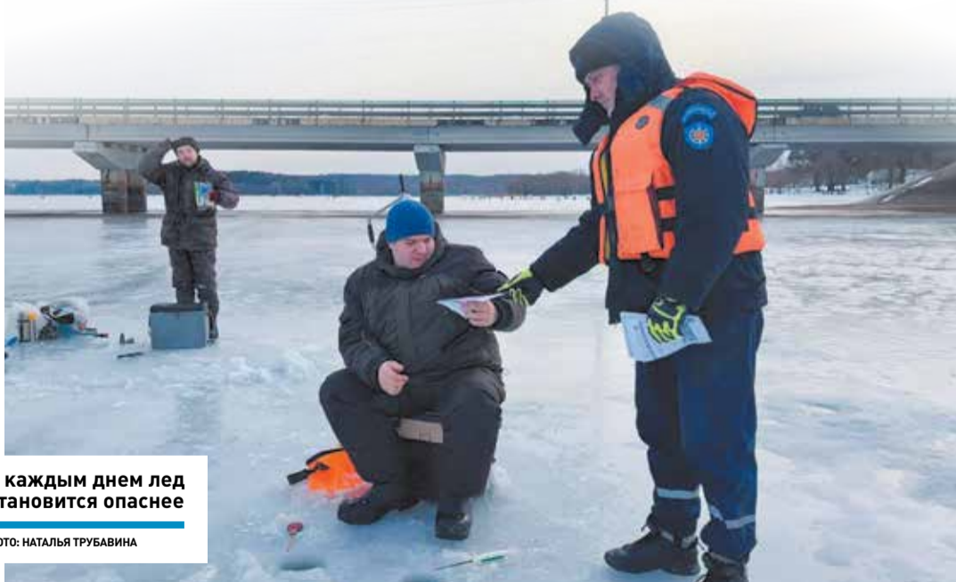
С каждым днем лед становится опаснее