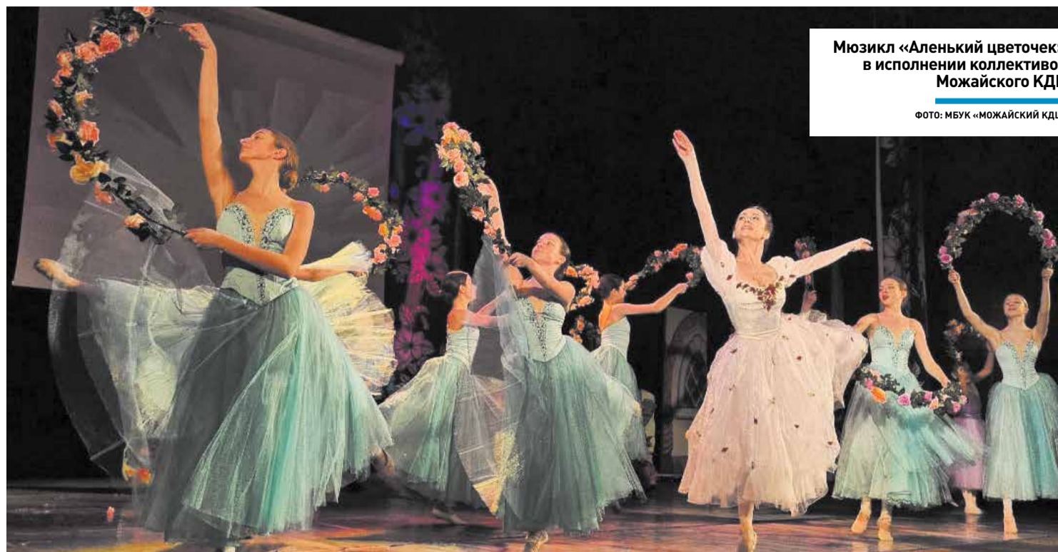
Мюзикл «Аленький цветочек» в исполнении коллективов Можайского КДЦ