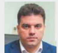
Денис МОРДВИНЦЕВ, глава Можайского городского округа: