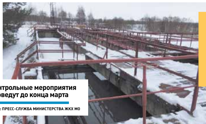
Контрольные мероприятия проведут до конца марта

«Минувшая календарная зима не принесла особых проблем с количеством выпавшего снега, а также погодными условиями, что в плановом порядке позволило начать подготовку к безопасному пропуску паводковых вод на территории Московской области, как на коммунальных объектах, так и на торфяниках», – сказал министр жилищно-коммунального хозяйства Мо-