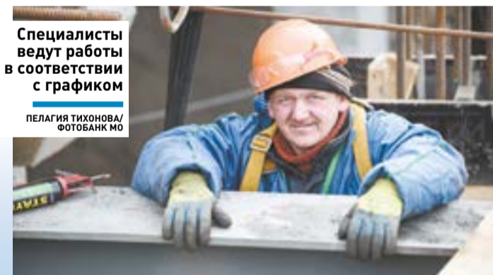
Специалисты ведут работы в соответствии с графиком

ИНФРАСТРУКТУРА ] Капитальный ремонт моста на автодороге Зарайск – Серебряные Пруды перешёл в новую фазу