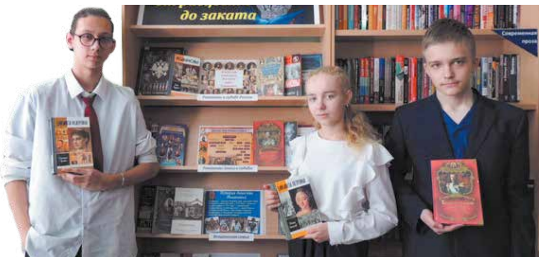
МУЖ «ЧЕСТГО ШАХОВСКАЯ»

В ШАХОВСКОЙ ЦЕНТРАЛЬНОЙ БИБЛИОТЕКЕ ОТКРЫЛАСЬ КНИЖНАЯ ВЫСТАВКА «РОМАНОВЫ: ОТ РАСЦВЕТА ДО ЗАКАТА», ПОСВЯЩЕННАЯ 410-ЛЕТИЮ ЦАРСКОЙ ДИНАСТИИ