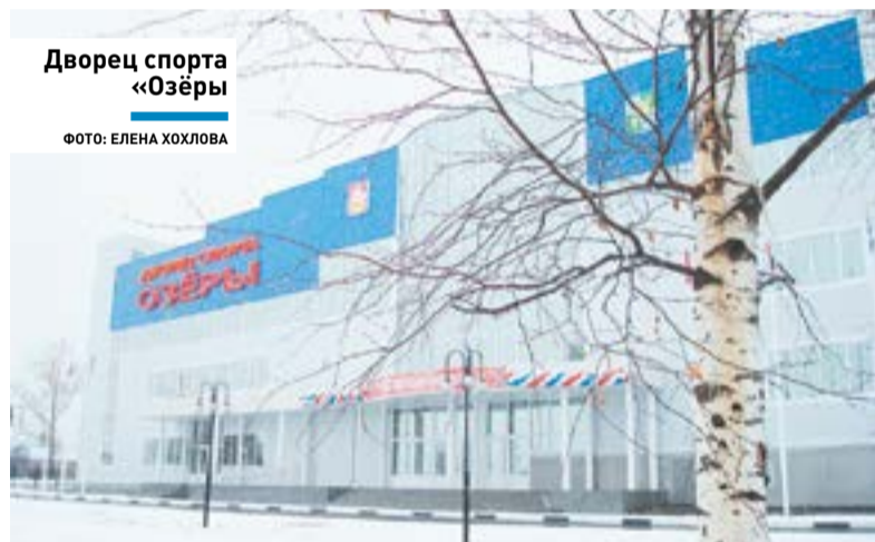
Дворец спорта «Озёры»

Горожане всегда любили спорт. Первый спортзал появился на Красных Озёрах