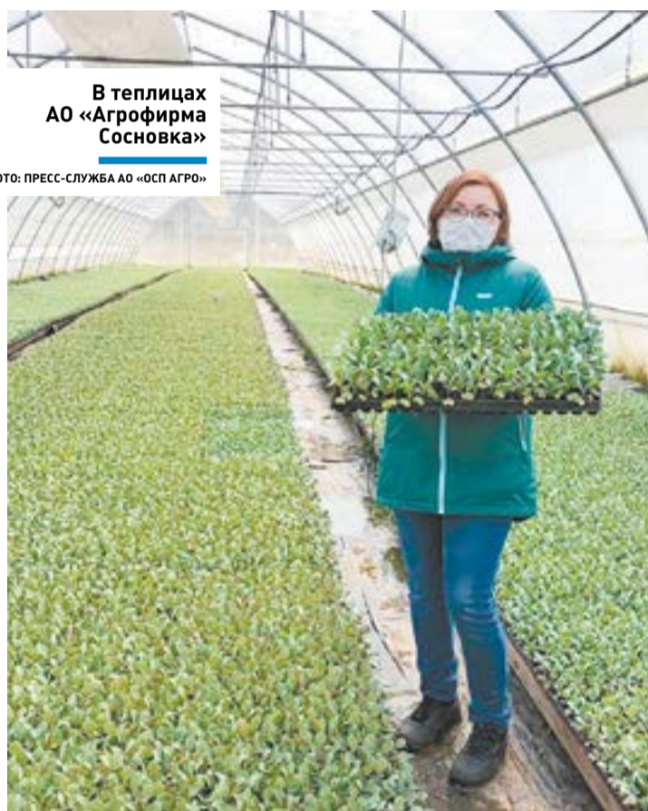
В теплицах АО «Агрофирма Сосновка»

К предстоящим полевым работам в хозяйствах готовятся заблаговременно – закупают посевной материал, удобрения. Но главное внимание – технике. Коллективы мехмастерских трёх наших крупных хозяйств АО «Озёры», АО «Предприятие Емельяновка», АО «Агрофирма Сосновка» завершают подготовку тракторов, посевных комплексов, культиваторов, дисковых борон и других сельхозмашин и агрегатов. Хорошие хозяева понимают, что от бесперебойной работы техники напрямую за-