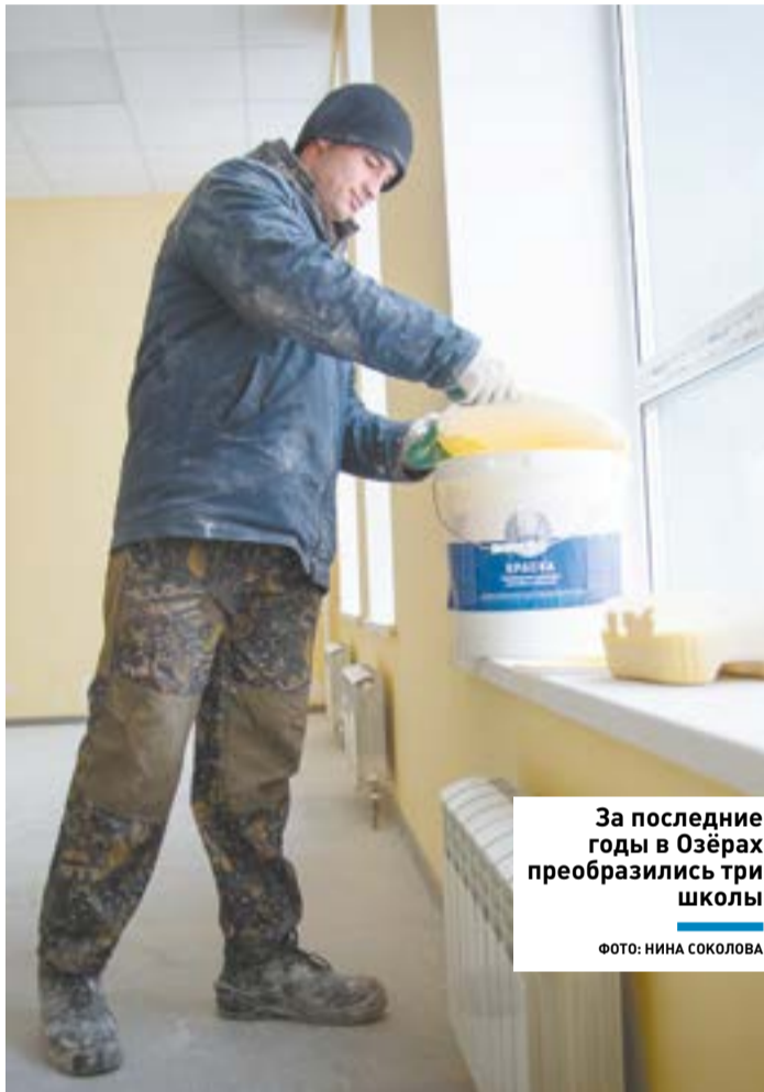
За последние годы в Озёрах преобразились три школы