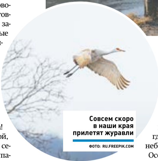
Совсем скоро в наши края прилетят журавли