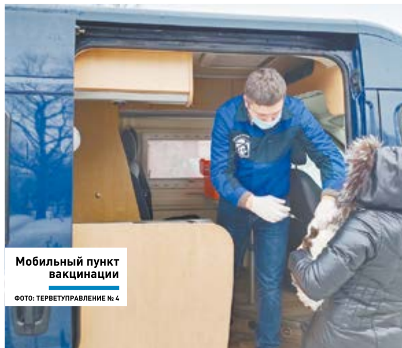
Мобильный пункт вакцинации

В прошлом году в Подмосковье было привито около 550 тысяч собак и кошек. Кроме того, более 1,5 млн брикетов с вакциной от бешенства были разложены в лесах Подмосковья для диких плотоядных животных: лисиц, енотовидных собак и других, встречающихся в наших лесах. Наряду с профилактикой бешенства, в Подмосковье проводится также работа по профилактике других заболеваний диких животных.