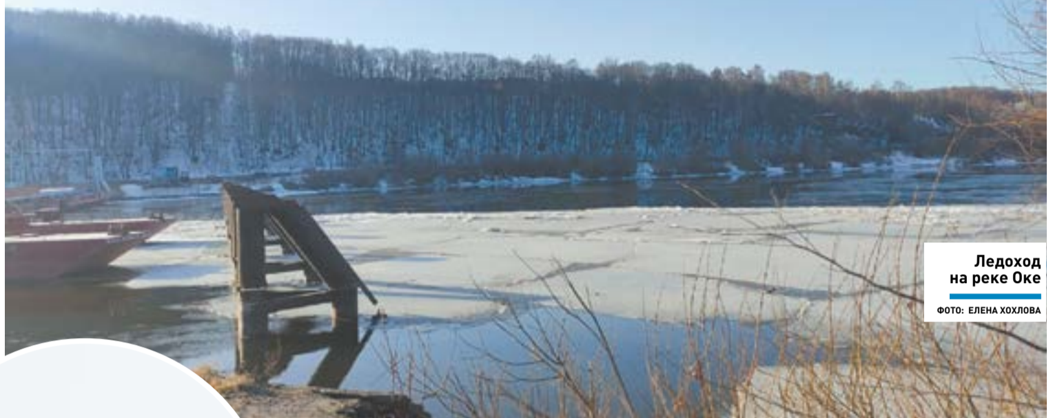
Ледоход на реке Оке

ВРЕМЯ ОБНОВЛЕНИЯ ] Весна для озерчан – это не только пробуждение природы, но временные, хотя и досадные неудобства в связи с разведением наплавного моста