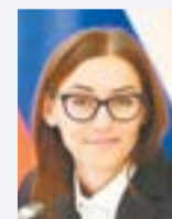
Екатерина ШВЕЛИДЗЕ, министр информационных и социальных коммуникаций Московской области:

Внести свою лепту можно в одном из 122 волонтерских пунктов Московской области. В Озёрах такой пункт располагается по адресу: пл. Советская, д. 1. Также можно сделать благотворительное пожертвование на сайте volontermo.ru .