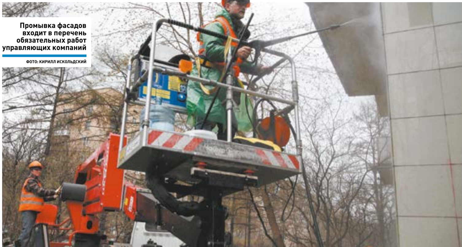
Промывка фасадов входит в перечень обязательных работ управляющих компаний

Кровли и водостоки, фасады и входные группы, подвалы и инженерные системы – всё это не только конструктивные элементы многоквартирного дома, но и этапы сезонных работ. И выполнить их предстоит абсолютно всем управляющим компаниям (УК) по окончании зимы.