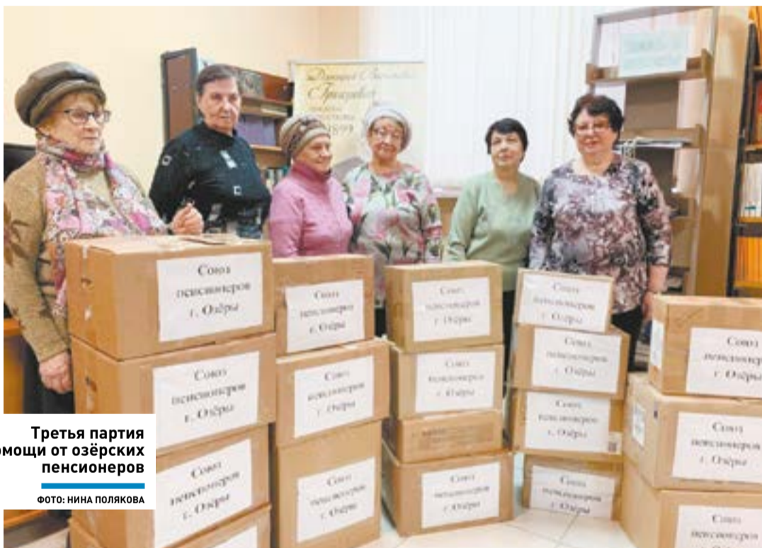
Третья партия помощи от озёрских пенсионеров

А у пенсионеров уже готова новая партия помощи бойцам. Члены местного отделения «Союза пенсионеров Подмосковья» закупили термобельё, связали сами 250 пар тёплых шерстяных носков и ещё заку-