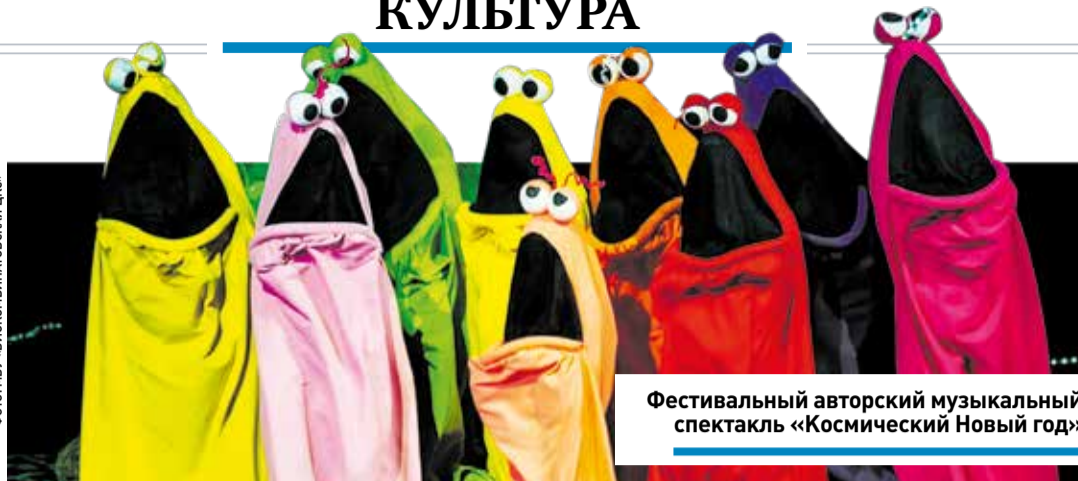
Фестивальный авторский музыкальный спектакль «Космический Новый год»