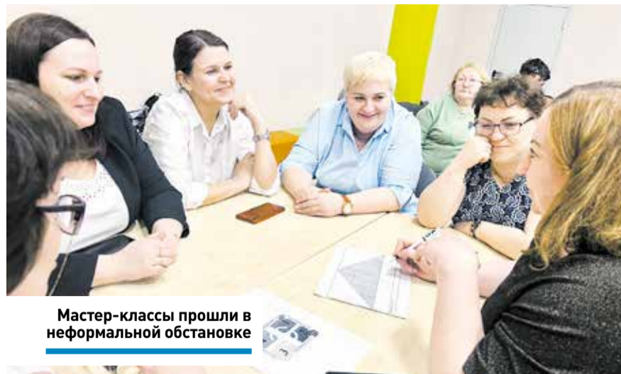
Мастер-классы прошли в неформальной обстановке