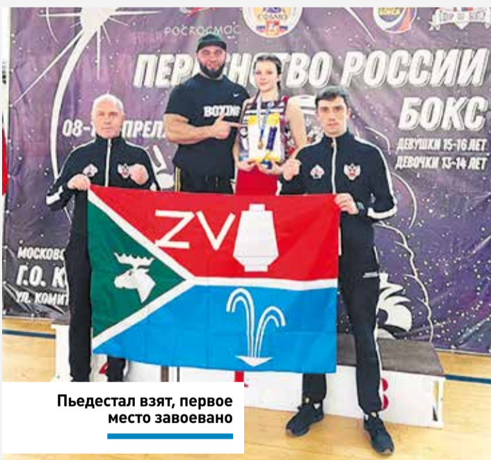
Пьедестал взят, первое место завоевано

– Я доволен всем, что увидел на этом турнире. Выделять какую-то спортсменку не хочу, все девушки очень старались. Уровень бокса, особенно в финалах, был высочайший.