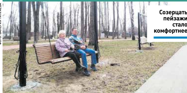
Созерцать пейзажи стало комфортнее

округа, многие бывают здесь с детьми, бегают, занимаются северной ходьбой или катаются на велосипедах. Это также площадка проведения различных мероприятий для горожан.