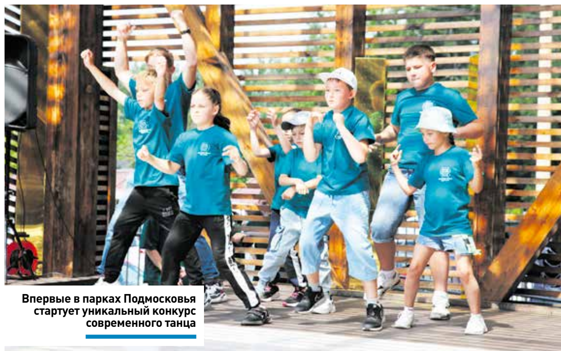
Впервые в парках Подмосковья стартует уникальный конкурс современного танца

Как сообщил министр культуры и туризма, фестиваль «Сыр. Пир. Мир» продлится до 10 дней в этом году. Важно обеспечить большое количество