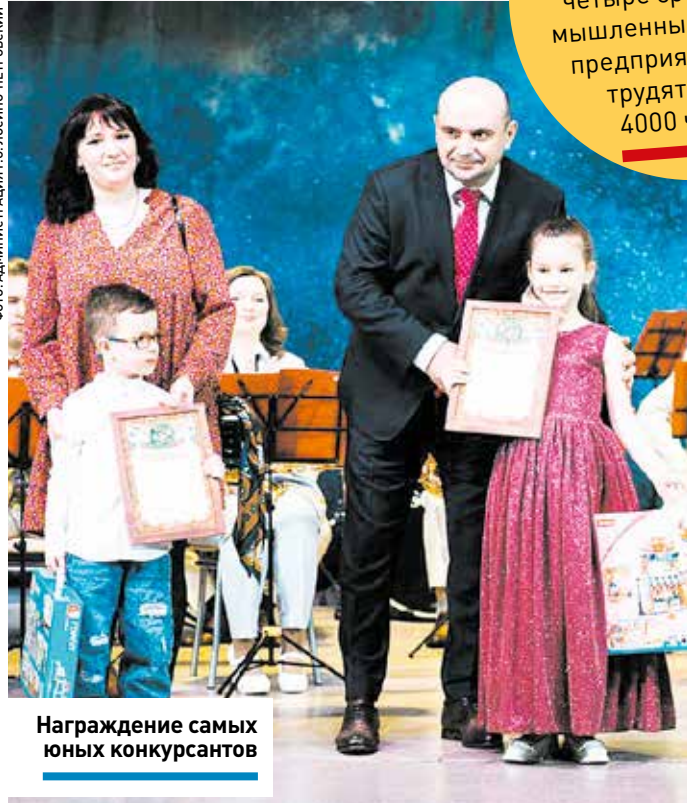
Награждение самых юных конкурсантов