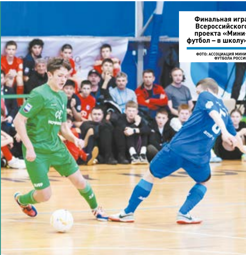
Финальная игра Всероссийского проекта «Мини-футбол – в школу»