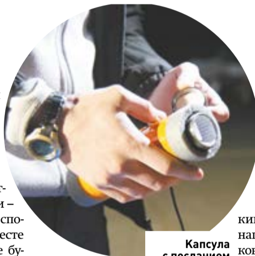
Капсула с посланием

Более ста российских детей от 14 до 18 лет, а также их ровесники из стран СНГ присоединились к проекту. Специальный бокс с аудиооборудованием прикрепили к стратостату. Голоса детей смогут услышать каждый желающий в районе полёта шара на