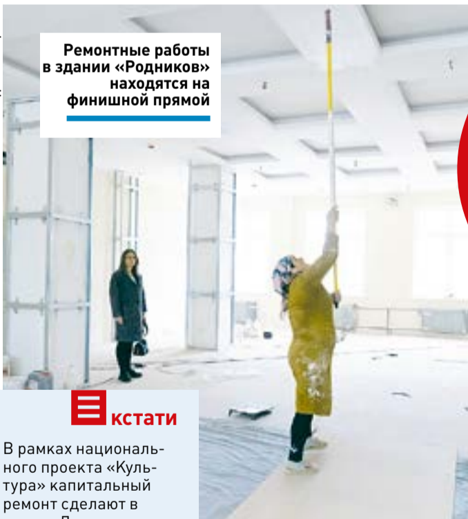
Ремонтные работы в здании «Родников» находятся на финишной прямой