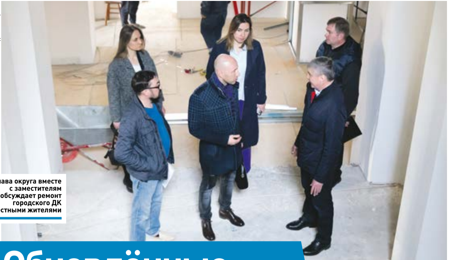
Глава округа вместе с заместителями обсуждает ремонт городского ДК с местными жителями