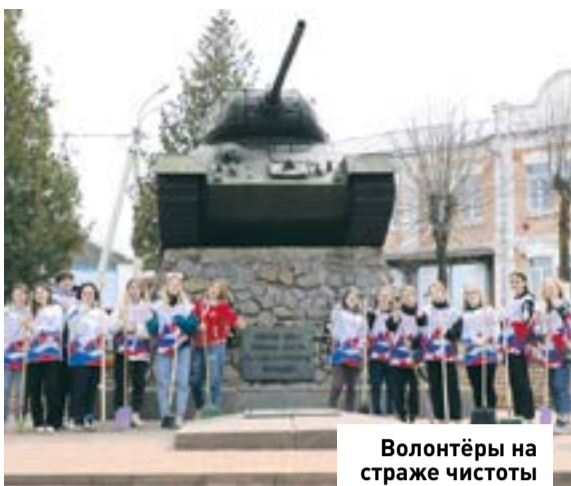
Волонтеры на страже чистоты