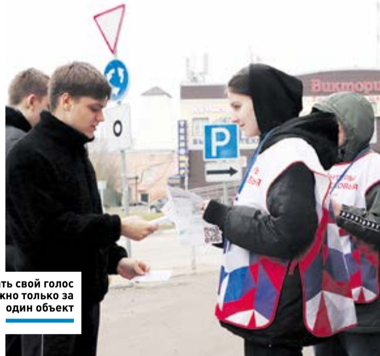
Отдать свой голос можно только за один объект

БЛАГОУСТРОЙСТВО ] Волонтеры помогают жителям проголосовать за общественные территории и дизайн-проекты благоустройства