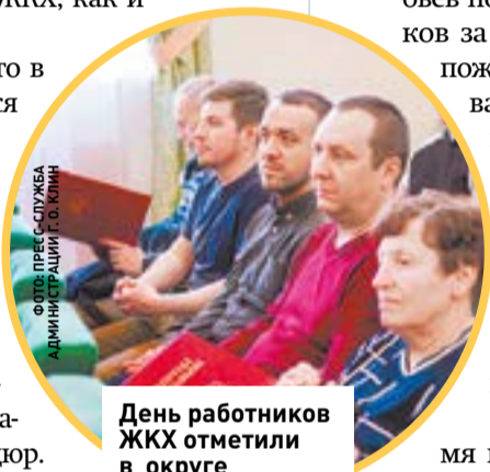
День работников ЖКХ отметили в округе