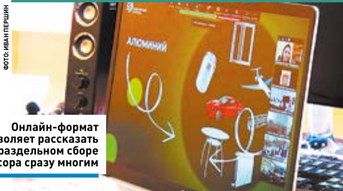
Онлайн-формат позволяет рассказать о раздельном сборе мусора сразу многим