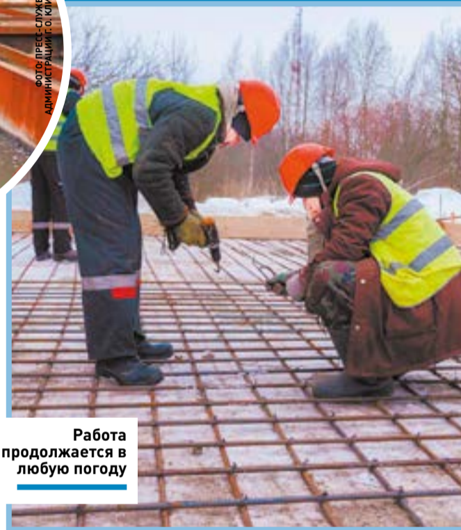
Работа продолжается в любую погоду

экология ] В городском округе Клин приступили к строительству новых очистных сооружений