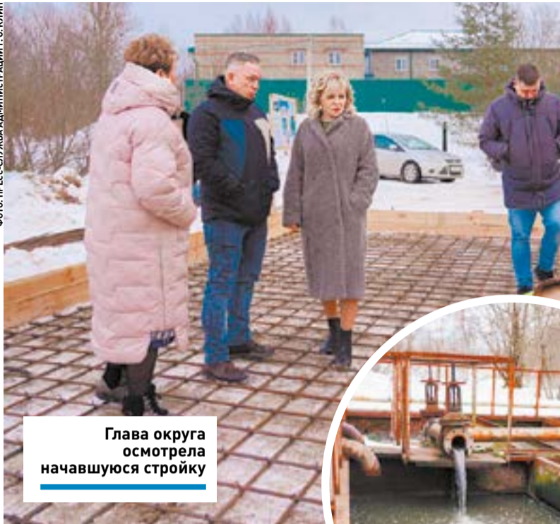
Глава округа осматривает начавшуюся стройку