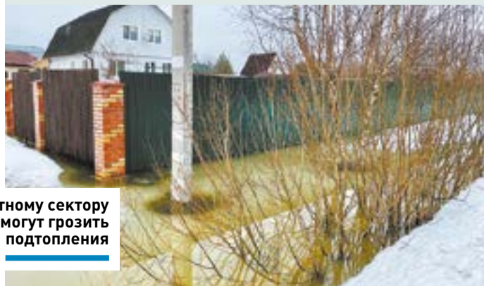
Частному сектору могут грозить подтопления