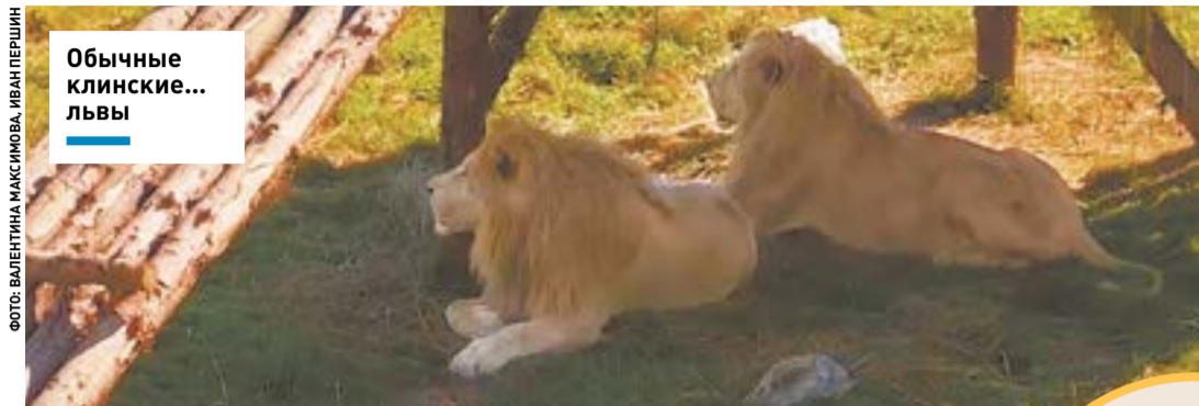
Обычные клинские... львы