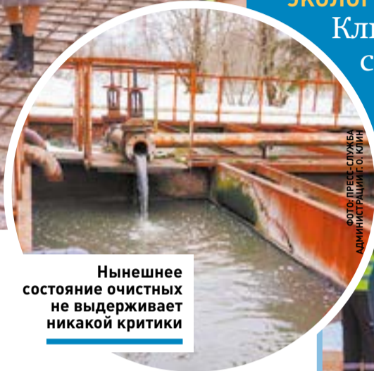
Нынешнее состояние очистных не выдерживает никакой критики