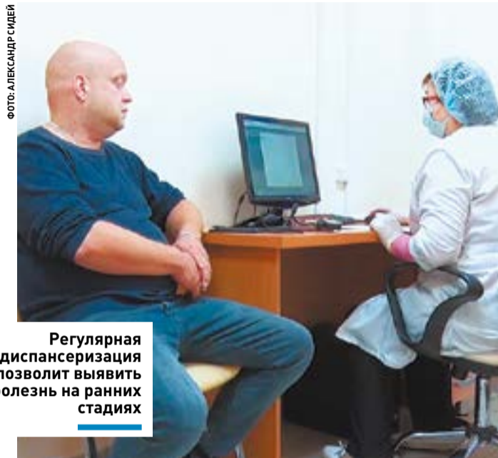
Регулярная диспансеризация позволит выявить болезнь на ранних стадиях

БЕРЕГИСЬ! ] В Клину уже зарегистрировано порядка 300 инфицированных