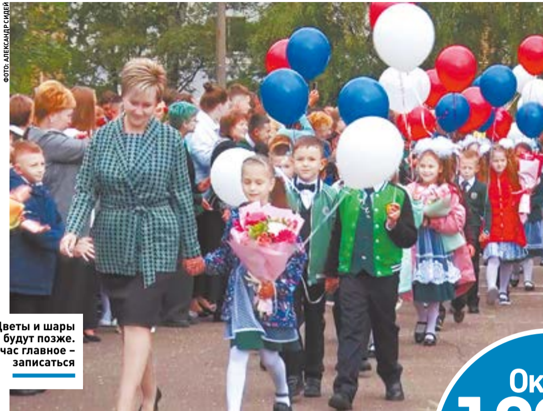
Цветы и шары будут позже. Сейчас главное – записаться

Министерство образования Московской области ведет большую разъяснительную работу с родителями будущих первоклашек для того, чтобы сделать процесс записи как можно более простым и прозрачным.