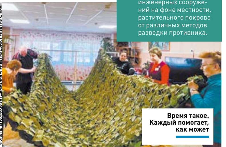
Время такое. Каждый помогает, как может