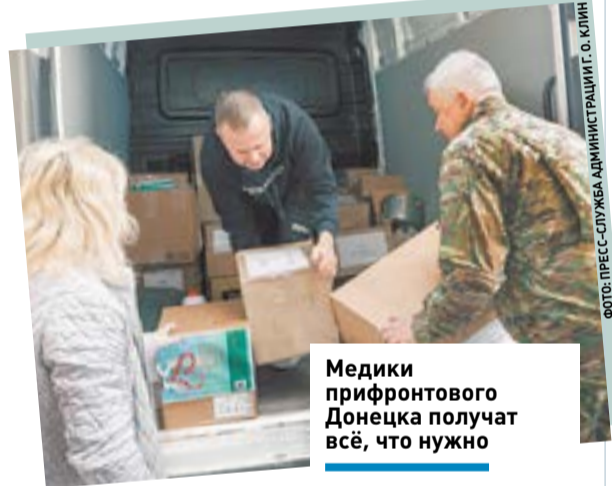
Медики прифронтового Донецка получают всё, что нужно

В этот раз клинчане посетили несколько больниц Донбасса и в том числе республиканский травматологический центр Донецка.