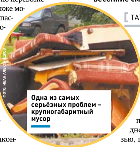
Одна из самых серьезных проблем – крупногабаритный мусор