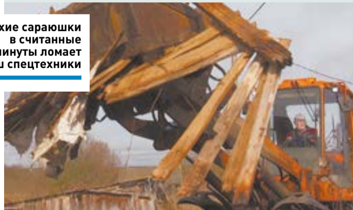
Ветхие сараюшки в считанные минуты ломает ковш спецтехники

нистрацию округа. И вот МБУ «Чистый город» приступило к ликвидации.