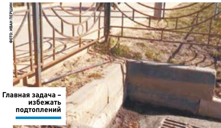
Главная задача – избежать подтоплений

«Мы ежемесячно объезжаем те точки, где чаще всего происходят подтопления. В перечне адресов – улицы Мира и Мечникова. Если рядом с затопленным участком находятся ливнеприемники, то мы их прочищаем, заодно осматриваем