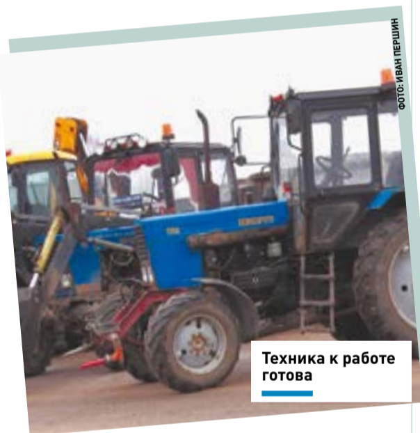
Техника к работе готова

На смотре представлена лишь малая доля парка организации. Часть техники занята уборкой общественных пространств, что-то