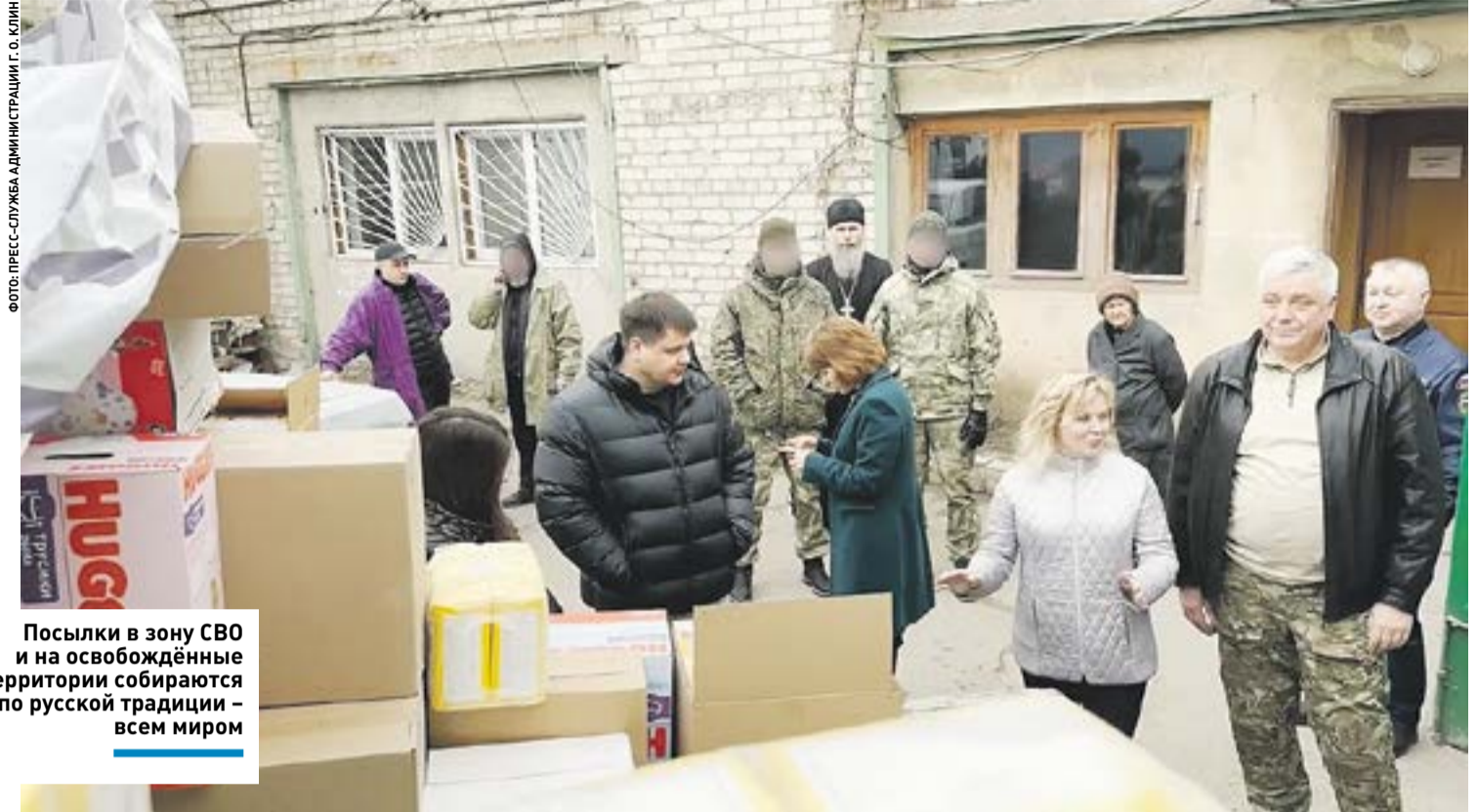
Посылки в зону СВО и на освобождённые территории собираются по русской традиции – всем миром

В рамках гуманитарной миссии делегация Клина уже побывала в Харцызске, Макеевке, Донецке, Дебальцево и селе Новогригорьевка, Ясиноватой и Сватово. Гуманитарную помощь передавали администрациям территорий, в больницы, и адресно