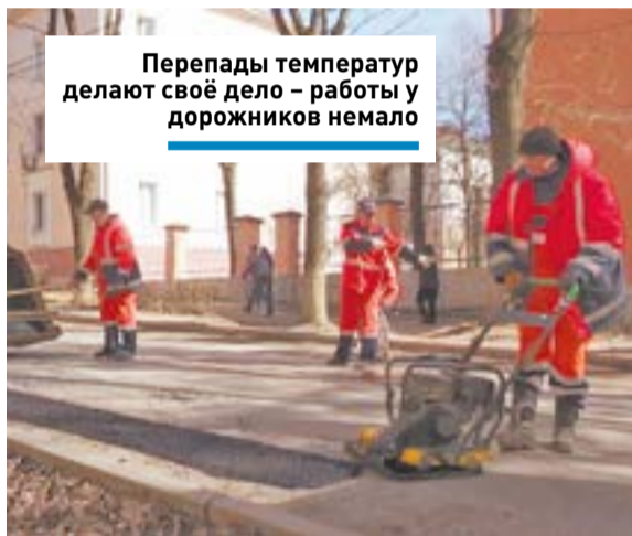
Перепады температур делают своё дело – работы у дорожников немало

«Проводится ремонт с применением горячего асфальтобетона. На сегодня запланированы работы не только на ул. Захватаева, но и на