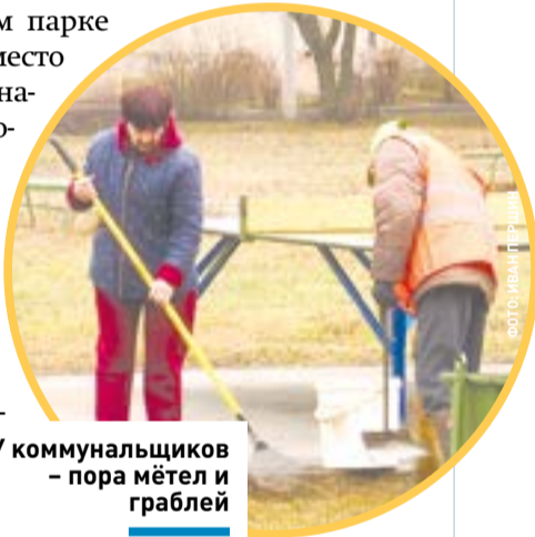
У коммунальщиков – пора метел и граблей