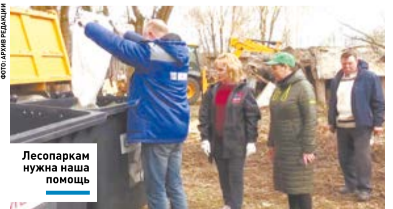
Лесопаркам нужна наша помощь

16 апреля клинчане примут участие в экологическом мероприятии, посвященном Празднику труда в Подмосковье. Его организаторами являются министерство культуры Московской области и детский центр Московской губернской универсальной библиотеки.