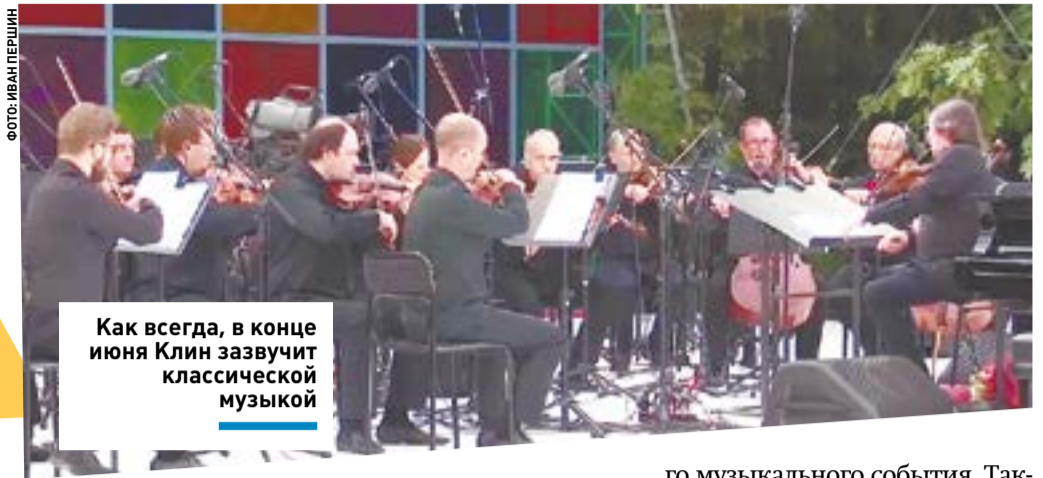
Как всегда, в конце июня Клин зазвучит классической музыкой

ФЕСТИВАЛЬ | В музее-заповеднике композитора Петра Ильича Чайковского начали подготовку к самому значимому мероприятию лета