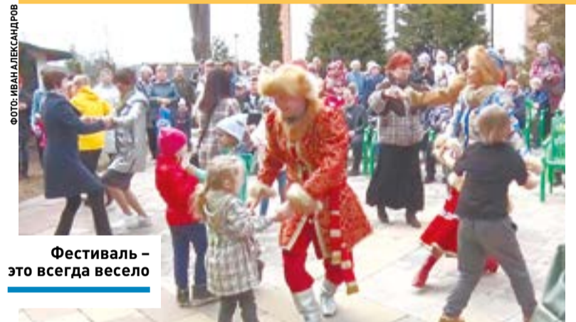
Фестиваль – это всегда весело

КУЛЬТУРА ] Православные мелодии вознеслись над усадьбой Демьяново