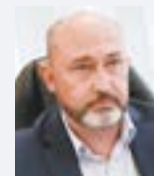
Антон ВЕЛИКОВСКИЙ, министр ЖКХ Московской области: