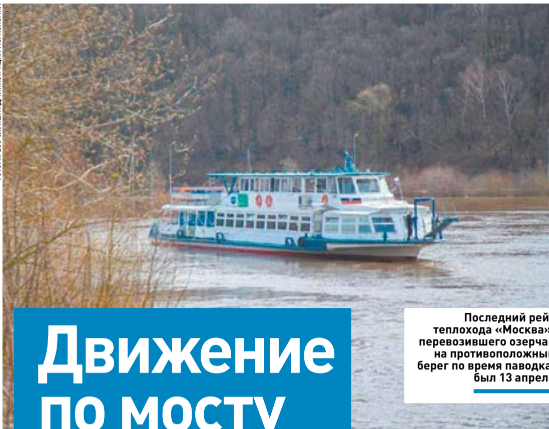
Последний рейс теплохода «Москва», перевозившего озерчан на противоположный берег по время паводка, был 13 апреля