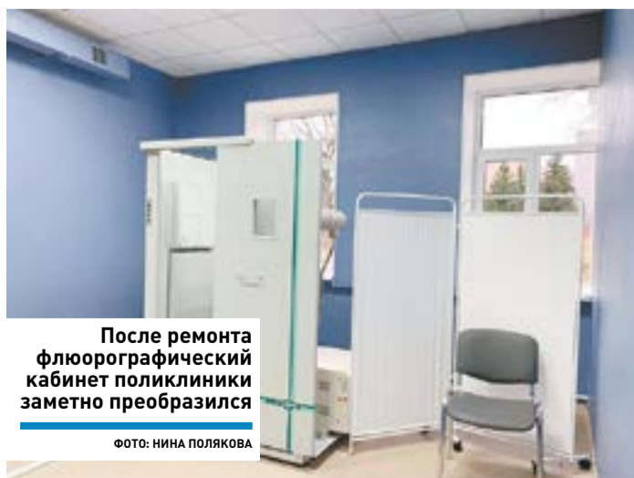
После ремонта флюорографический кабинет поликлиники заметно преобразился