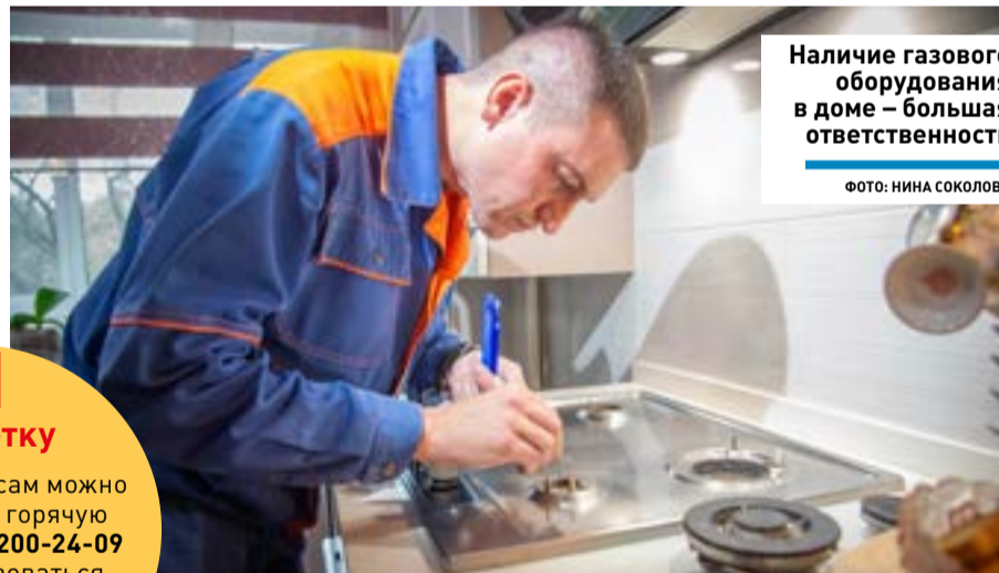
Наличие газового оборудования в доме – большая ответственность

В нашем округе, как и во всём Подмосковье, усиливают контроль за состоянием газового оборудования