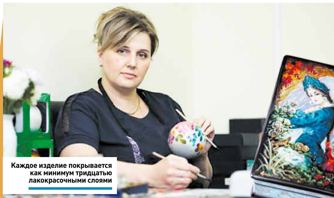
Каждое изделие покрывается как минимум тридцатью лакокрасочными слоями

Если хотите побыть в роли мастера сами, обязательно запишитесь на мастер-класс. Создать свой собственный шедевр вам предложат на оригинальной шкатулке, броши или панно. Здесь же, при