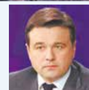
Андрей ВОРОБЬЕВ, губернатор Московской области:

ЦСС – это проектный офис, на единой площадке которого собраны представители различных органов власти и организаций, участвующих в процессе реализации инвестиционных проектов на всех этапах.