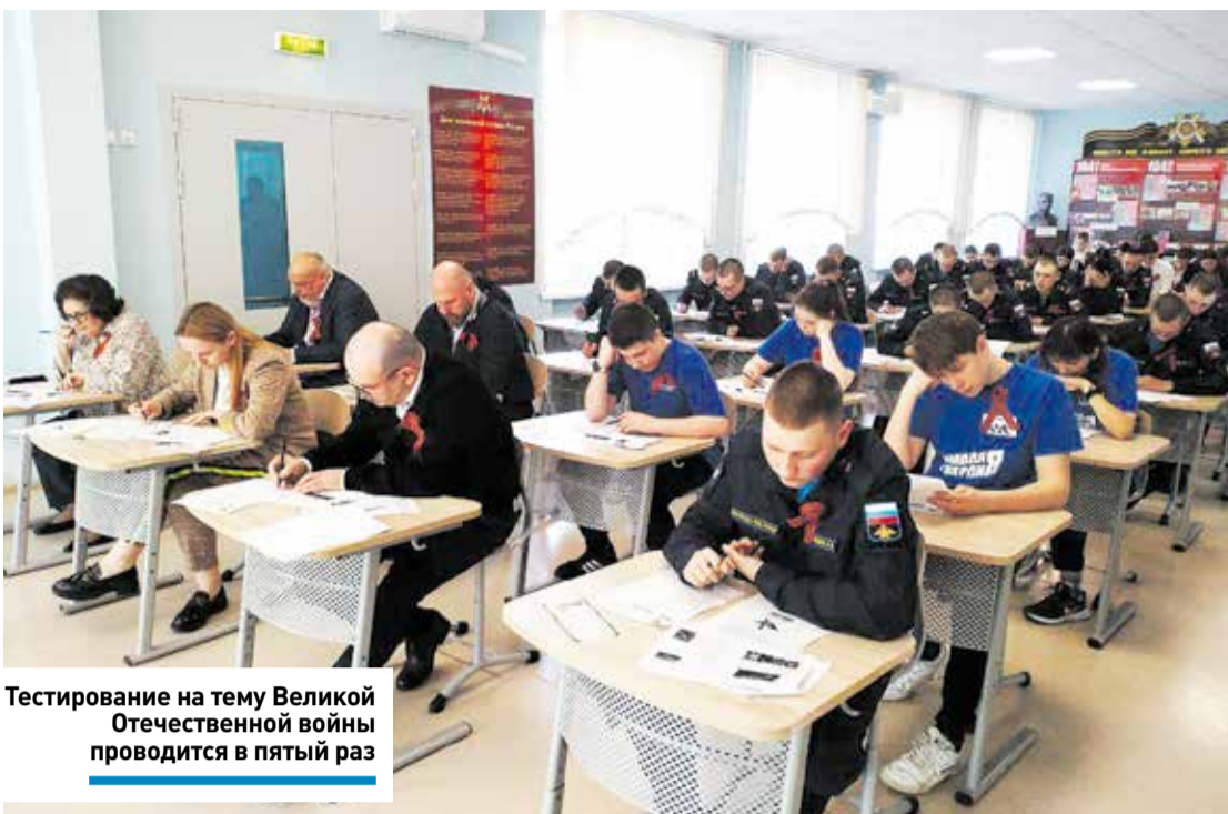
Тестирование на тему Великой Отечественной войны проводится в пятый раз