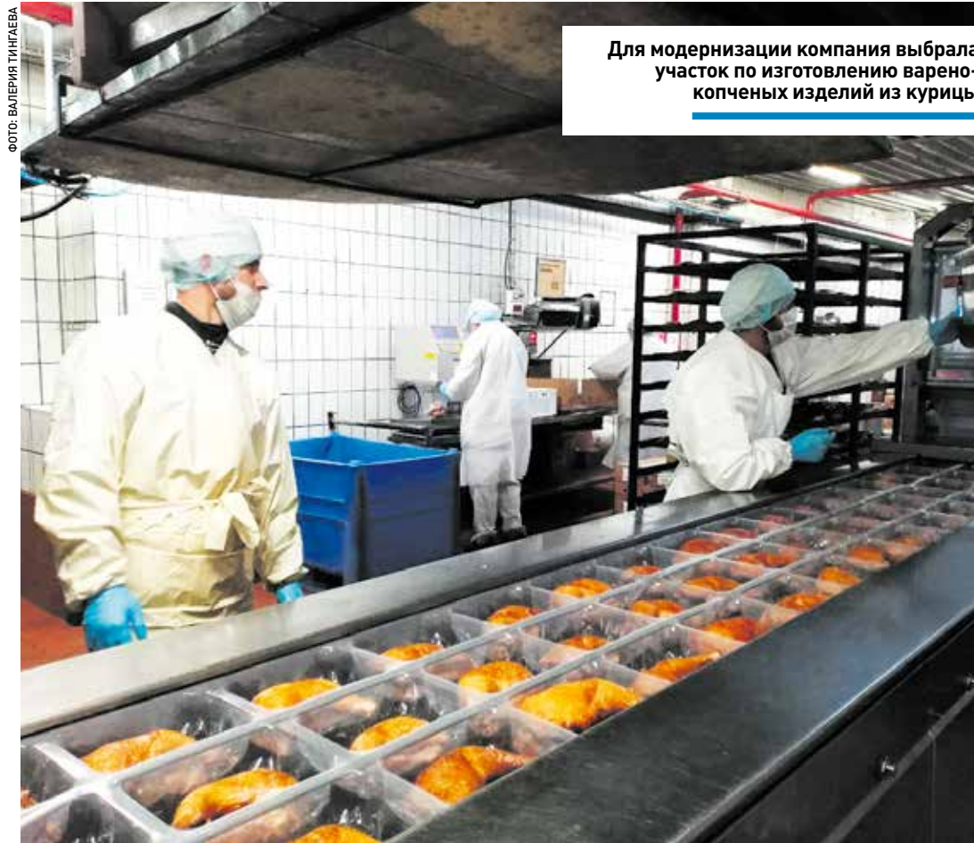
Для модернизации компания выбрала участок по изготовлению варено-копченых изделий из курицы

БИЗНЕС | Новую концепцию, основанную на бережливом подходе, реализуют на местном предприятии