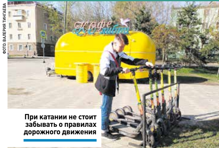
При катании не стоит забывать о правилах дорожного движения