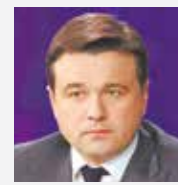
Андрей ВОРОБЬЁВ, губернатор Московской области:

Сбор и обучение в центре проходят за 3–5 дней