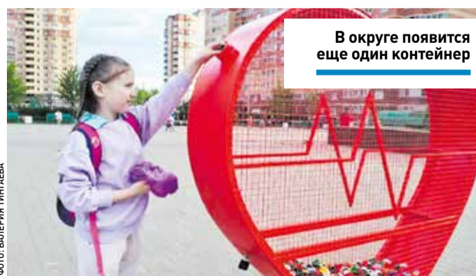
В округе появится еще один контейнер