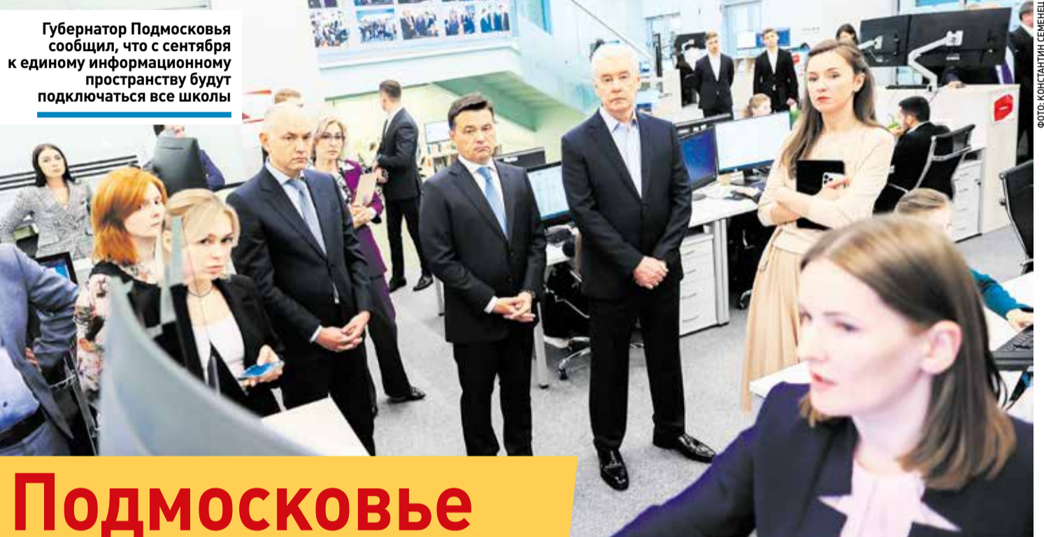
Губернатор Подмосковья сообщил, что с сентября к единому информационному пространству будут подключаться все школы

Сергей Собянин уточнил, что правительство Москвы окажет техническую поддержку и помощь во внедрении сервисов, используемых для создания системы.