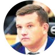
Владимир ЛОКТЕВ , министр строительного комплекса Московской области:

– В 2024 году мы приступаем к следующему этапу: расселению аварийного жилья, которое признано таковым до 1 января 2022 года.