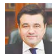
Андрей ВОРОБЬЁВ, губернатор Московской области:

Предприниматель может возместить до 50% от стоимости приобретенного оборудования