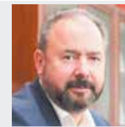
Александр САМАРИН , министр энергетики Московской области: