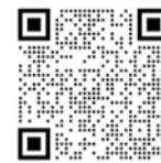
График отключения горячего водоснабжения опубликован на интерактивной карте МКД Московской области