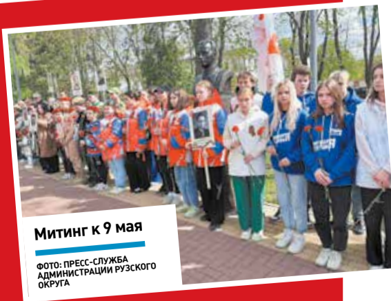
Митинг к 9 мая