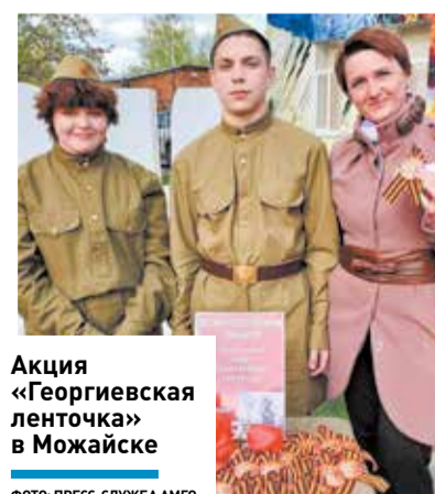
Акция «Георгиевская ленточка» в Можайске

Это праздник мужества, отваги и беззаветной любви к Родине. Мы искренне гордимся тем, что являемся наследниками великих традиций служения Отечеству, завещанных нам ветеранами. Мы горды вкладом Можайской земли в Великую Победу.