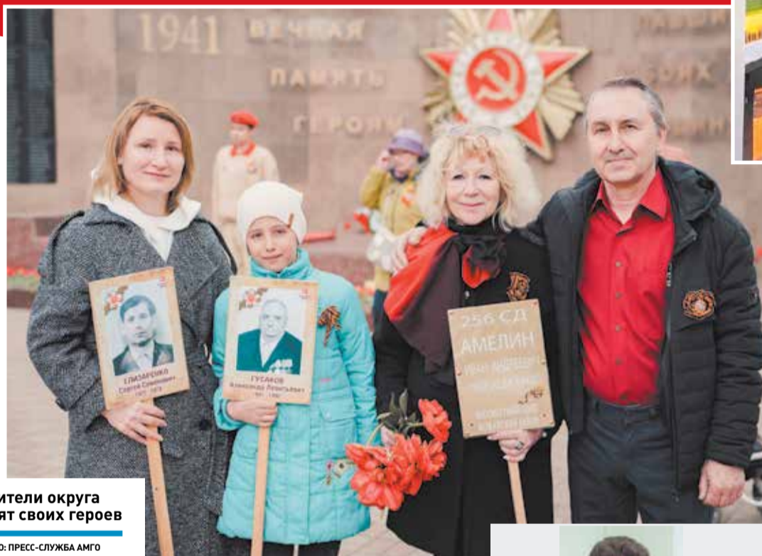
Жители округа чтят своих героев

«Бессмертный полк», патриотические акции и концерты – в округе отметили День Победы