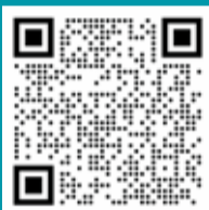
График профилактических работ на котельных опубликован на интерактивной карте МКД Московской области

Для профилактических работ потребуется не более 14 дней