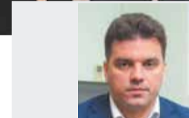
Денис МОРДВИНЦЕВ, глава Можайского городского округа: