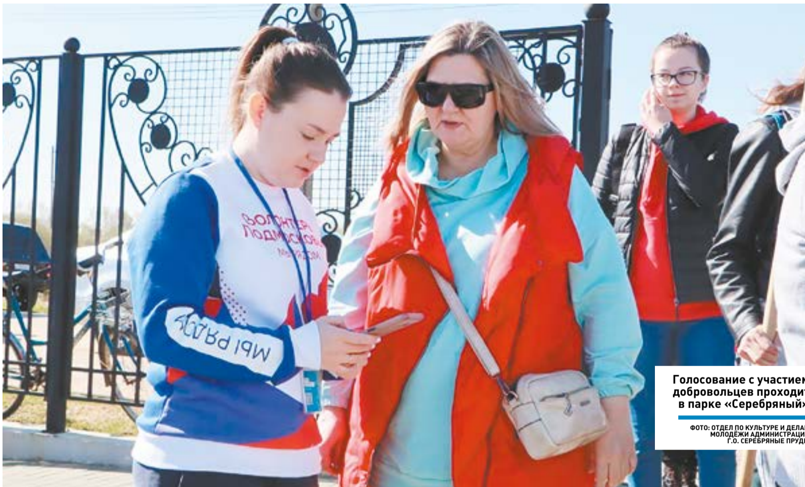
Голосование с участием добровольцев проходит в парке «Серебряный»