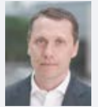
Михаил ХАЙКИН, министр благоустройства Московской области: