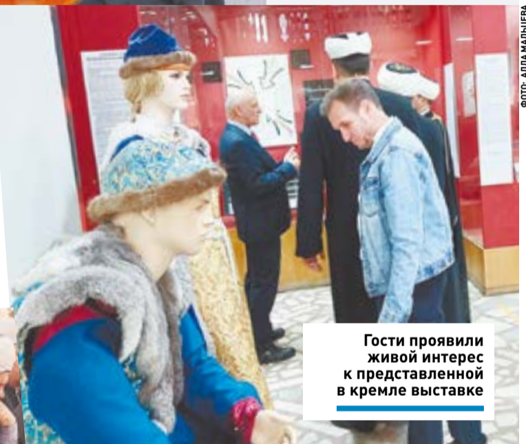
Гости проявили живой интерес к представленной в кремле выставке