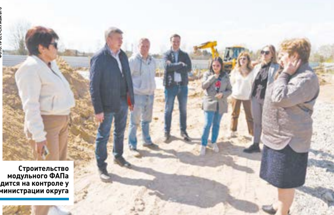
Строительство модульного ФАПа находится на контроле у администрации округа