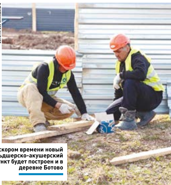
В скором времени новый фельдшерско-акушерский пункт будет построен и в деревне Ботово