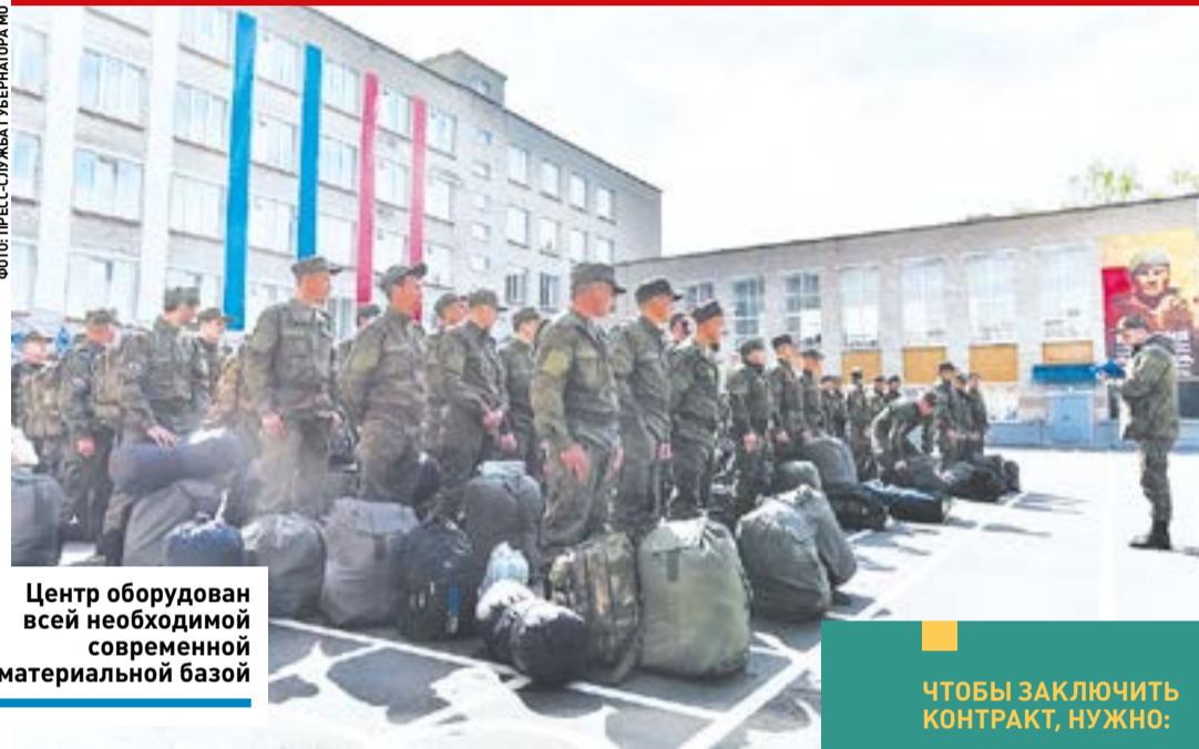
Центр оборудован всей необходимой современной материальной базой

ной службы к конкретной военно-учетной специальности, а также требованиям по физической подготовленности. Среди требований также значится образование не ниже полного среднего (11 классов) и возраст не моложе 18 и не старше 40 лет.