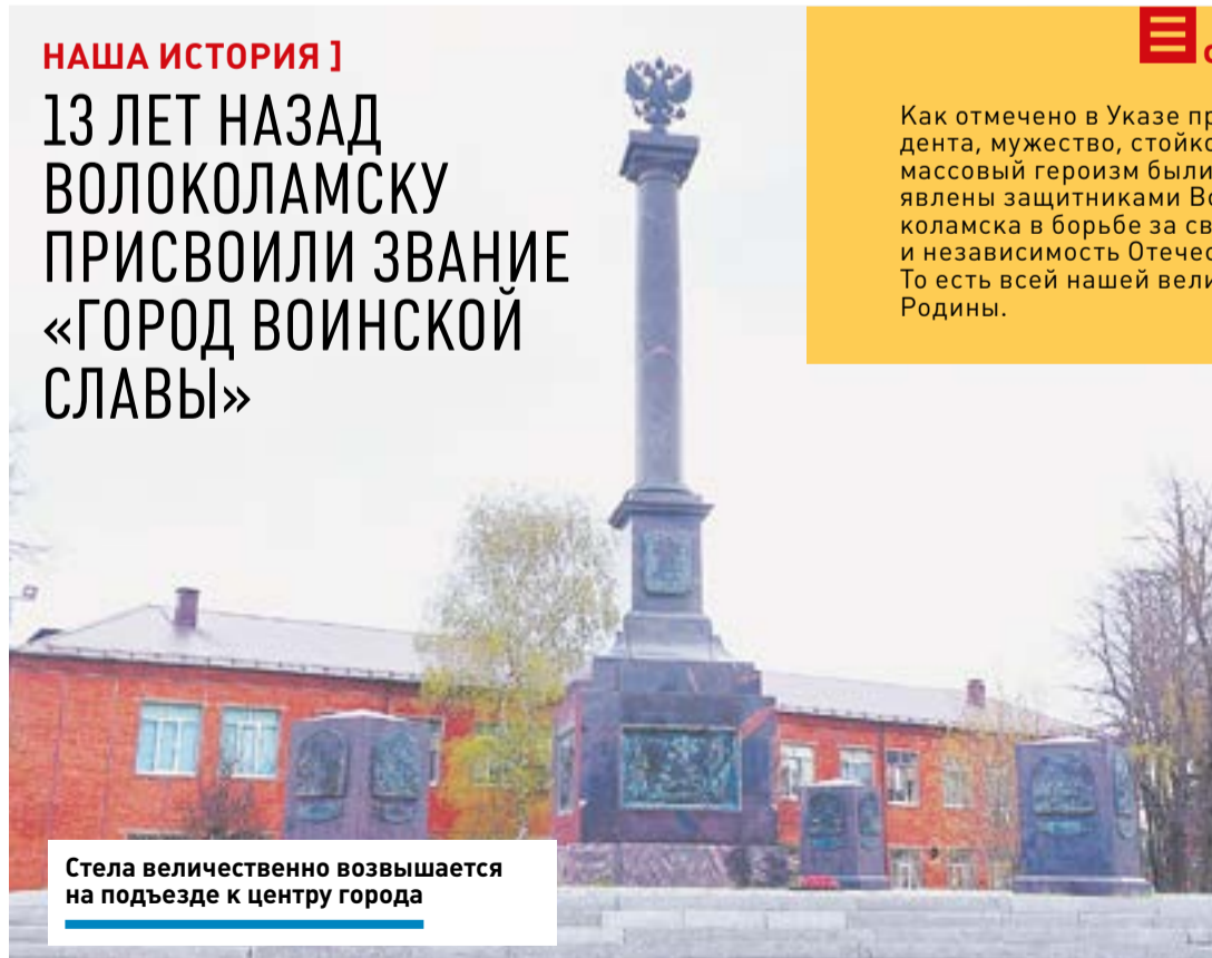
Стела величественно возвышается на подъезде к центру города