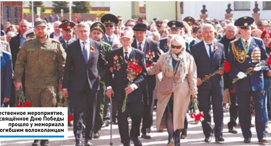
Торжественное мероприятие, посвящённое Дню Победы прошло у мемориала погибшим волоколамцам