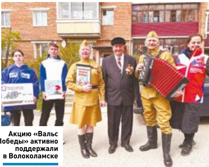
Акцию «Вальс Победы» активно поддержали в Волоколамске