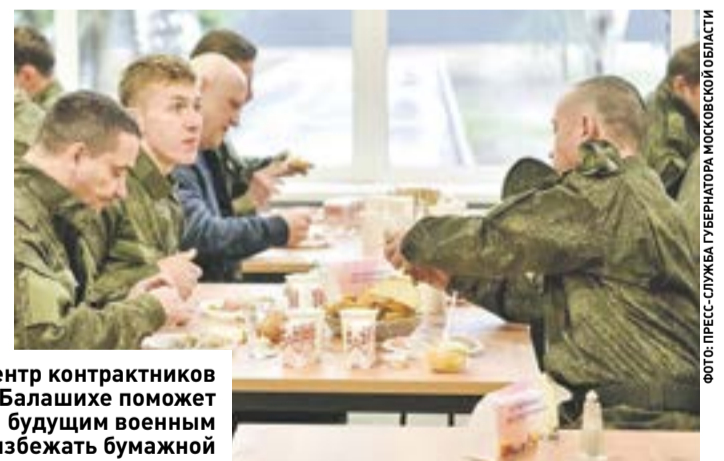
Центр контрактников в Балашихе поможет будущим военным избежать бумажной волокиты

– Получить все необходимые консультации можно и в специализированном центре для контрактников в Балашихе, который открылся благодаря инициативе и поддержке губернатора Московской области Андрея Воробьёва.