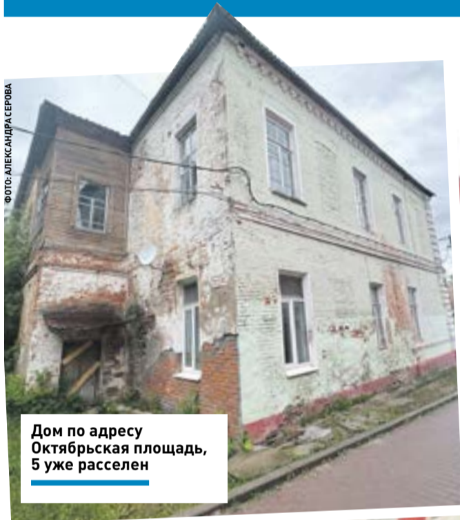
Дом по адресу Октябрьская площадь, 5 уже расселен

В настоящее время формируется новая госпрограмма по переселению аварийного фонда, в которую подлежат включению многоквартирные дома, уже признанные аварийными в период с 1 января 2017 года по 31 декабря 2021 года.