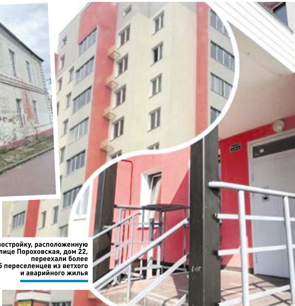
В новостройку, расположенную на улице Пороховская, дом 22, переехали более 65 переселенцев из ветхого и аварийного жилья