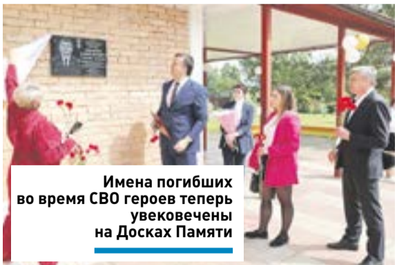
Имена погибших во время СВО героев теперь увековечены на Досках Памяти