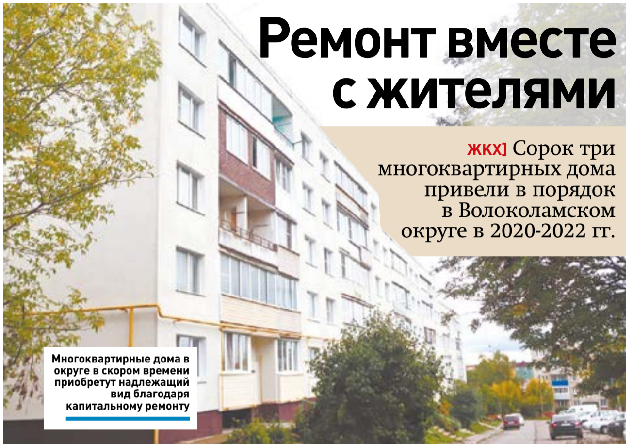
Многоквартирные дома в округе в скором времени приобретут надлежащий вид благодаря капитальному ремонту