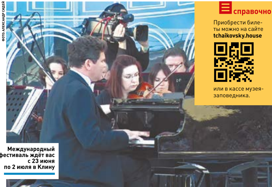
Международный фестиваль ждёт вас с 23 июня по 2 июля в Клину