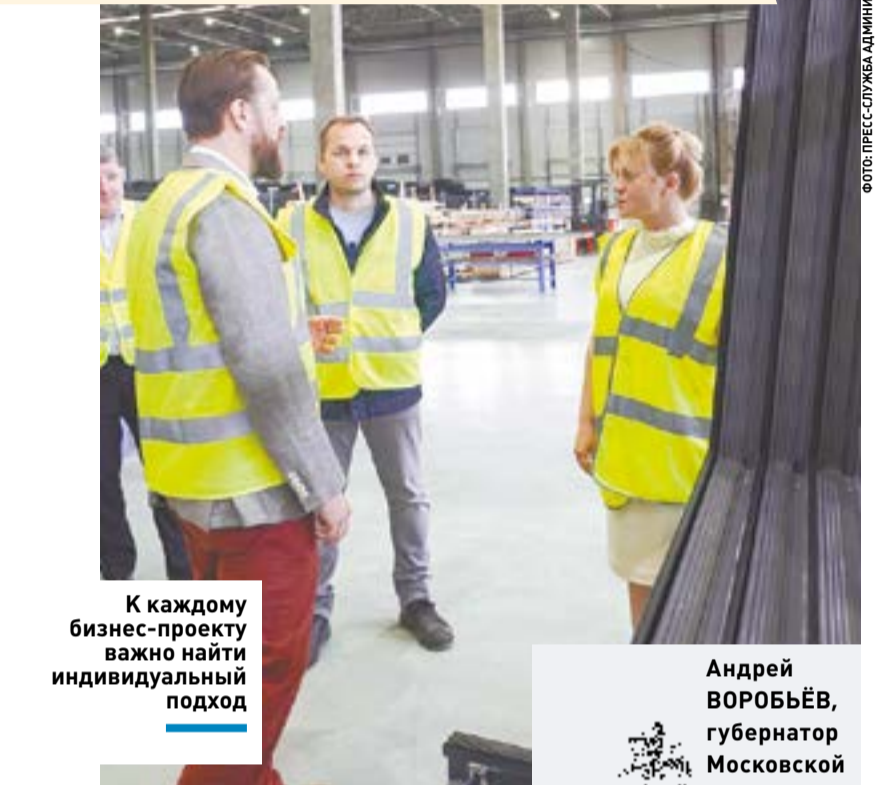
К каждому бизнес-проекту важно найти индивидуальный подход

Малое и среднее предпринимательство играют важную роль в экономике городского округа Клин. В 2021 году городской округ Клин стал обладателем премии губернатора Московской области «Прорыв года» в номинации «Ма-