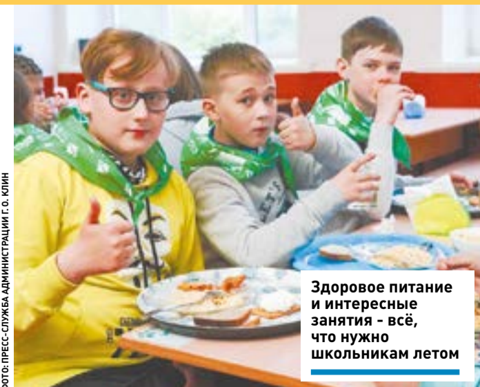
Здоровое питание и интересные занятия – всё, что нужно школьникам летом

от». В этом году впервые в Клину на базе МОУ «Гимназия № 2» будет реализован региональный проект «Умные каникулы», который охватит более 1400 обучающихся 2-8 и 10 классов.