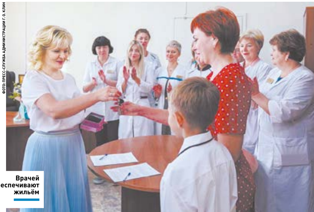
Врачей обеспечивают жильём

– Мы ищем «жемчужины», привлекаем лучших врачей. Для этого предусмотрели ряд мероприятий. Самое эффективное – когда врач, приезжающий из другого региона, по сути, имеет бесплатное жилье. Это компенсация аренды. Это компромисс аренды. И второй эффективный способ – когда врач приглашает своего друга. Впервые мы видим в Подмоскovie плюсовый баланс и по врачам, и по медсестрам. Поиск продолжаем дальше, – отметил губернатор Московской области Андрей Воробьёв.