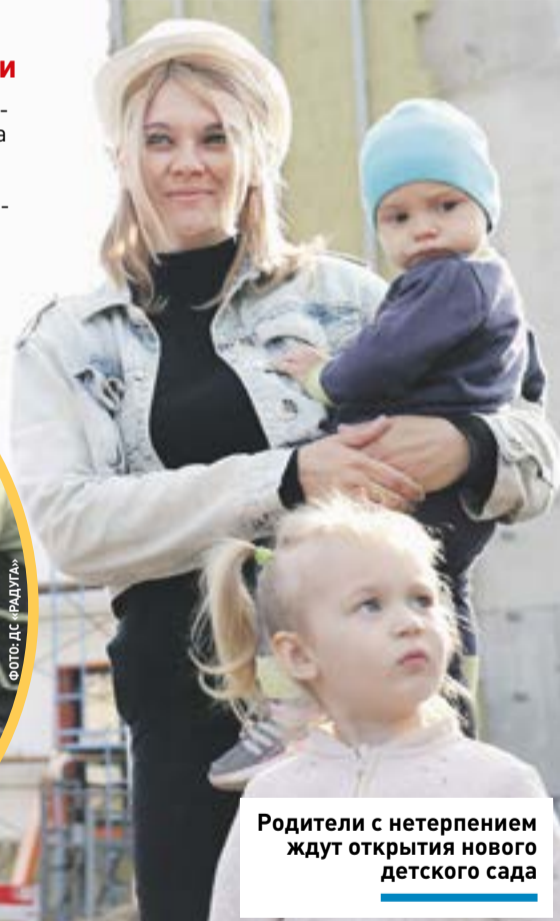
Родители с нетерпением ждут открытия нового детского сада

На территории округа расположены 22 дошкольных отделения и 2 детских сада – № 9 и № 21, один из которых, соответственно, сейчас находится на капитальном ремонте, а второй активно строится