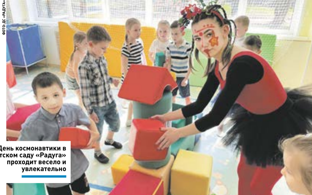
День космонавтики в детском саду «Радуга» проходит весело и увлекательно