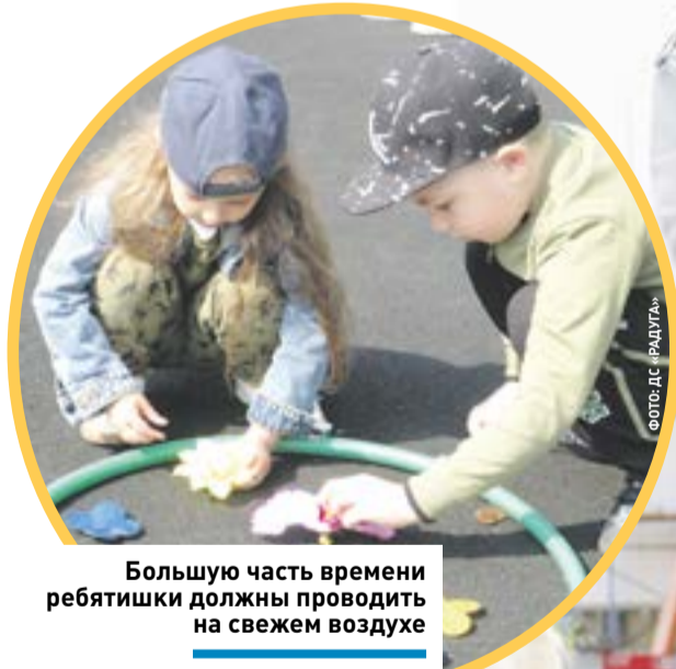
Большую часть времени ребята должны проводить на свежем воздухе

В детском саду № 21 помимо групп общеразвивающей направленности будет открыта группа для детей с ограниченными возможностями здоровья (ОВЗ), рассчитанная на 5-6 человек. Также в планах открытие круглосуточной группы, что будет удобно для родителей, работающих во вторую смену или вахтовым методом.