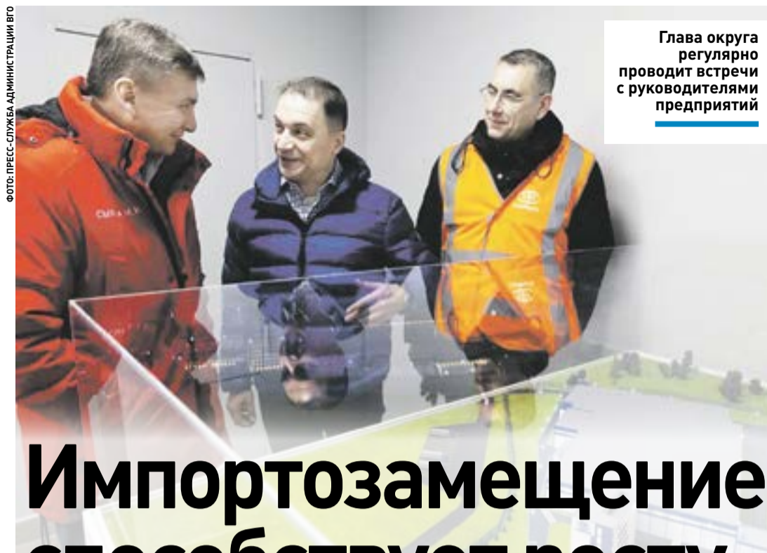
Глава округа регулярно проводит встречи с руководителями предприятий

А действующим предприятием ООО «Лама Торф» планируется запуск линии по производству металлических труб с пластиковым покрытием.