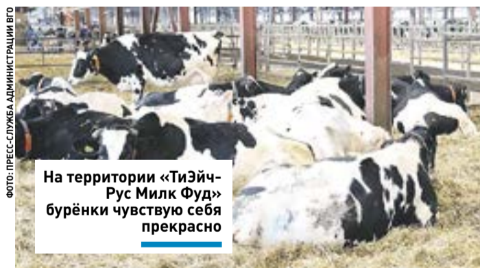
На территории «ТиЭйч-Рус Милк Фуд» бурёнки чувствуют себя прекрасно

На территории Волоколамского городского округа сформированы муниципальные земельные участки, готовые для передачи новым потенциальным инвесторам. Общая свободная площадь для размещения резидентов составляет 60 га