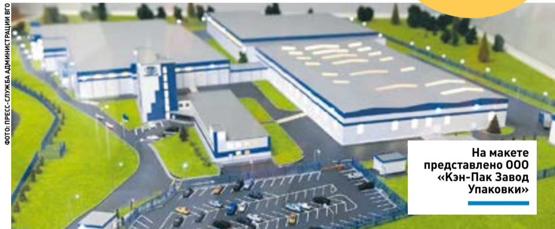
На макете представлено ООО «Кэн-Пак Завод Упаковки»

Губернатор отметил, что за прошлый год на территории Подмоскovie запустили 21 предприятие, а в планах на этот год – 50.