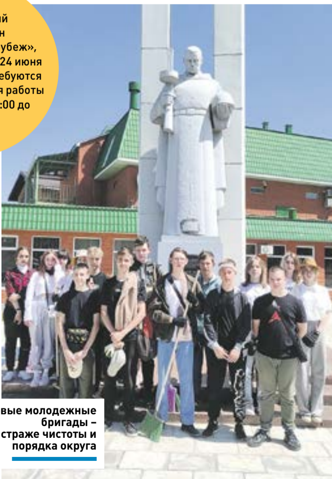
Трудовые молодежные бригады – на страже чистоты и порядка округа

На ежегодный полумарафон «Волоколамский рубеж», который состоится 24 июня в Волоколамске, требуются волонтеры (18+) для работы на маршруте с 07:00 до 15:00.