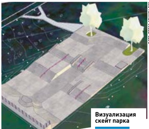
Визуализация скейт парка

Архитектурное решение скейт-парка должно подходить для тренировок любителей индивидуальных видов колесного спорта, таких как скейтбординг, экстремальный самокат, ролики, велосипеды BMX.