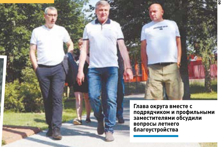
Глава округа вместе с подрядчиком и профильными заместителями обсудили вопросы летнего благоустройства