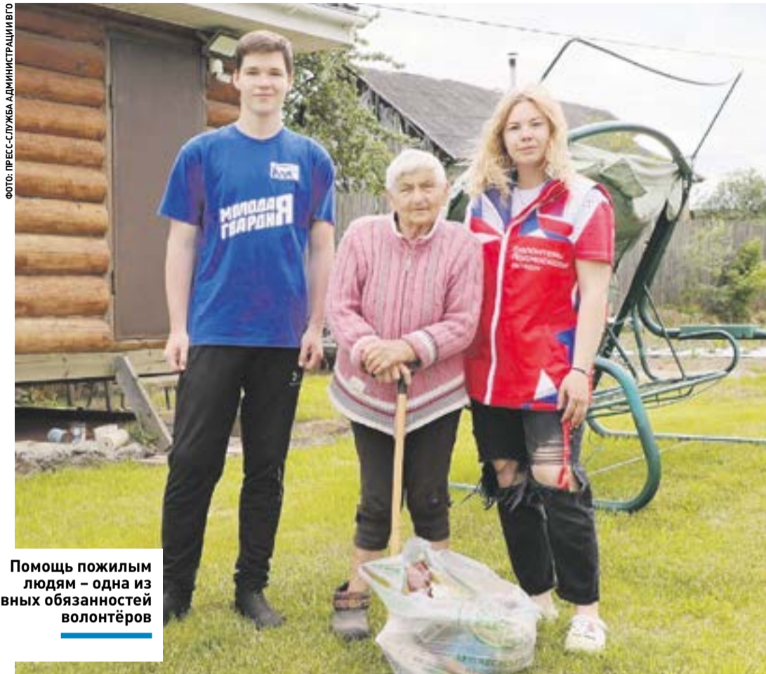
Помощь пожилым людям – одна из главных обязанностей волонтеров

А на днях юные активисты «Молодежного содружества» покосили траву во